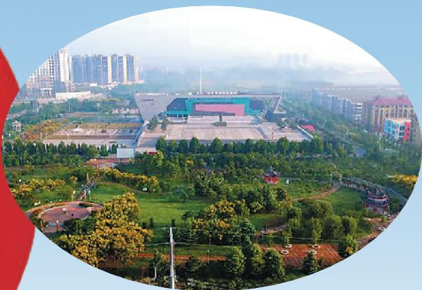
绿色环抱的吉鸿昌将军纪念馆