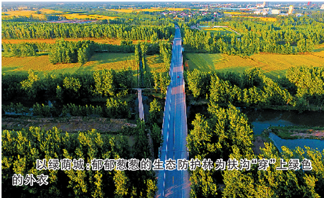
以绿荫城:郁郁葱葱的生态防护林为扶沟“穿”上绿色的外衣