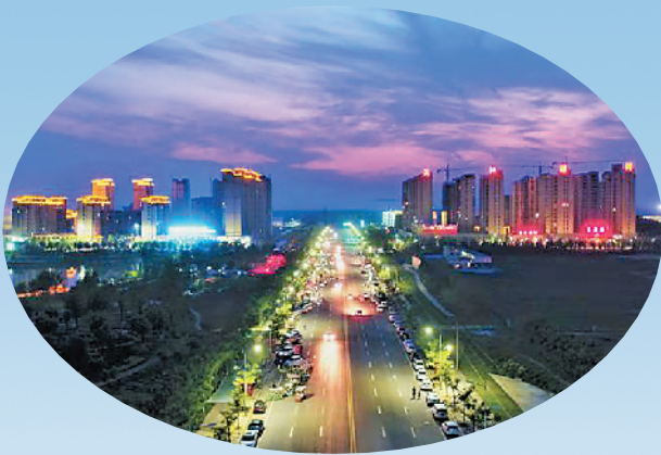
流光溢彩的扶沟夜景