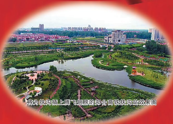
将为扶沟插上腾飞翅膀的郑合高铁扶沟站效果图