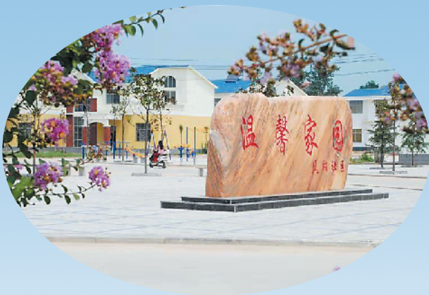
环境优美的凤翔社区温馨家园