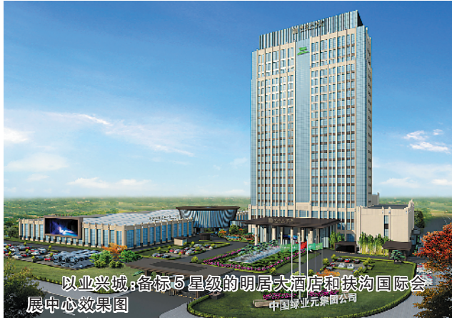
以业兴城:备受 5 星级的明居大酒店和扶沟国际会展中心效果图