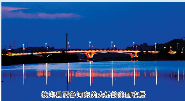
扶沟县贾鲁河东美大桥的美丽夜景

大鹏一日同风起,扶摇直上九万里。扶沟县将乘着百城建设提质工程的东风,继续抓好彰显城市特色、经营城市、多元化投入等工作,全力以赴抓规划、推项目、补短板、提品位,构建水清岸绿、生态优美的城市家园,努力擦亮扶沟特色城市名片,加快城市提质发展,以城市建设高质量发展推动经济社会发展高质量,不断增强群众的获得感和幸福感。