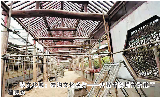
以文化城:扶沟文化名片——大程书院提升改建工程现场