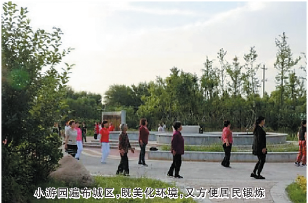
小游园遍布城区,既美化环境,又方便居民锻炼