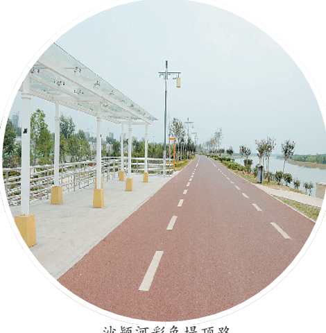
沙颍河彩色堤顶路