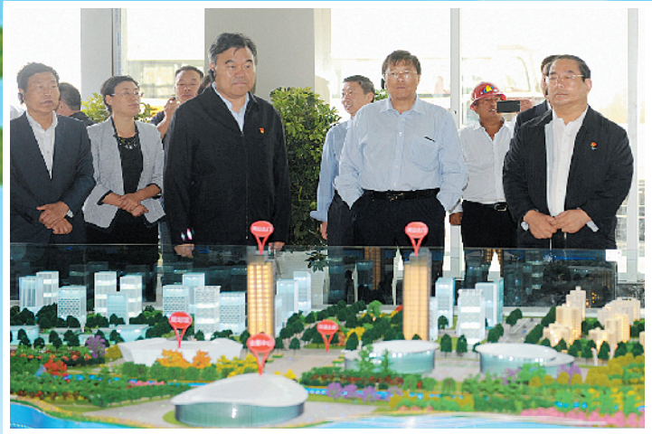
市委书记刘继标、市长丁福浩到引黄调蓄工程检查指导工作