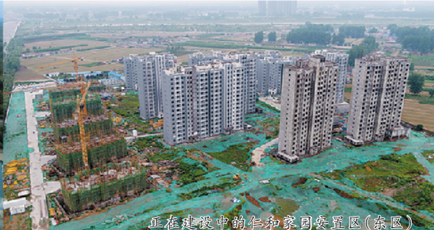
正在建设的郑合高铁周口安置区(东区)