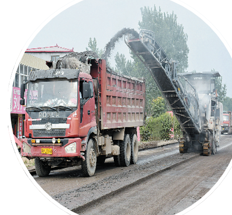
文昌大道东延提升改造工程施工现场

加宽及北延、人和路加宽及北延等5条道路通车里程7.6公里提升改造;围绕商务中心区建设,完善庆丰路、腾飞路等4条道路通车里程8.7公里新建工程;围绕职教文卫园建设,完善恒山路、光明路等4条道路通车里程2.7公里新建工程;围绕高铁新城片区建设,完善彩虹大道、恒山路等4条道路通车里程6.4公里,新建工程和高铁片区综合交通枢纽及配套工程PPP项目(一期)7.87公里综合管廊工程;围绕民生工程和项目建设,完善康泰路、胜利街2条道路通车里程1.4公里新建工程;围绕提升新区城市形象,完善文昌大道(周口大道至大广高速)7.7公里机动车道大修及景观绿化、亮化工程提升和文昌大道东延工程(S324升级改造城区段)7.2公里道路建设,进一步完善城市功能框架,逐步形成大交通格局,确保灯亮路畅。