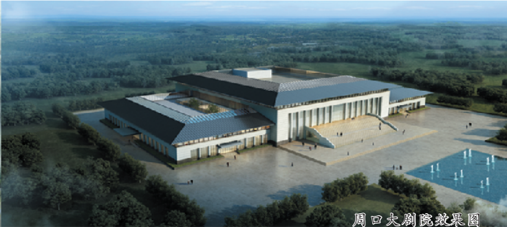
周口大剧院效果图