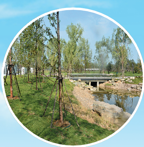
建业绿色基地景区一角