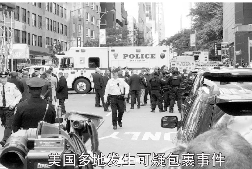
美国多地发生可疑包裹事件 △10月24日，警察在美国有线电视新闻网(CNN)位于纽约曼哈顿的办公地点所在大楼外执勤。当日，美国有线电视新闻网(CNN)位于纽约曼哈顿的办公地点发现有爆炸装置的包裹，楼内人员被紧急疏散。 继美国特勤局两天来分别截获寄往美国前第一夫人希拉里·克林顿和美国前总统奥巴马住宅的可疑包裹后，24日，美国再度发生多起可疑包裹事件，引发广泛关注。