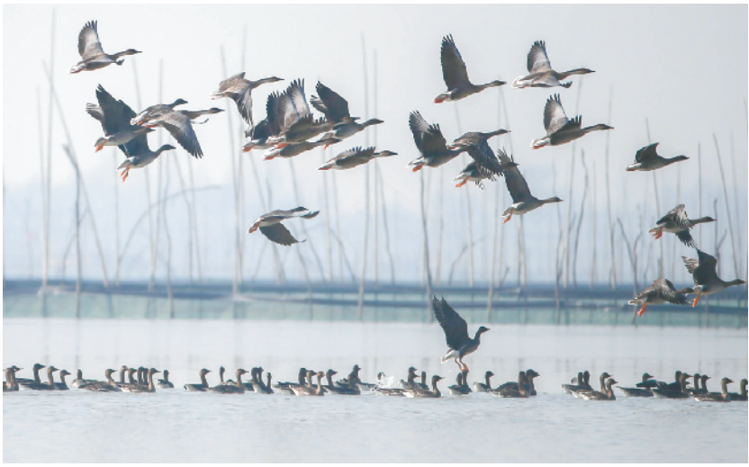
江苏盱眙:湿地成为“候鸟乐园”

新华社北京11月12日电（齐中熙 赵健）记者从中国铁建股份有限公司获悉，历经4年的艰苦施工，我国十三五期间的重点建设项目、四川两河口水电站控制性工程——跨库特大桥12日按期实现主桥合龙，这也是目前我国在藏区修建的最高公路桥。 据中铁十八局集团跨库特大桥项目经理刘玉兴介绍，位于四川省甘孜藏族自治州的两河口水电站跨库特大桥，位于海拔2900多米的川西高原，全长628米。主桥设计采用了T型刚构混凝土连续梁结构，最大跨度220米的主桥一跨飞越雅砻江大峡谷，矗立在悬崖峭壁上的桥墩群桩基础深达52米，主桥墩高172米。 由于大桥所处环境属于高寒、高烈度地震区，昼夜温差大。加之大桥桥面距离江面的高度超过了280米，瞬间最大风力可达十三级，工程风险和施工技术难度国内罕见。建设、设计、监理和施工单位联合展开攻关，不断优化技术方案，成功实现大桥高墩和桥梁主体的线型精度控制，主桥合龙的精度误差控制在5毫米，为明年9月大桥建成通车奠定了基础，同时也为两河口水电站按期建成发电创造了条件。