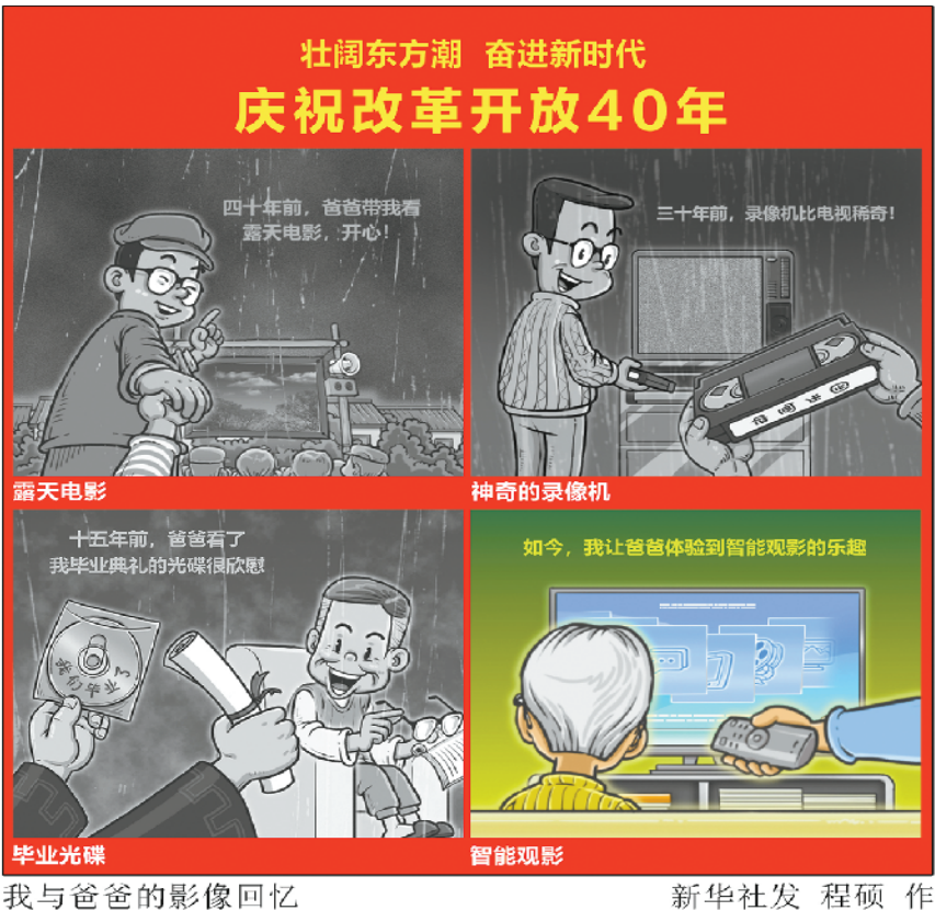
我与爸爸的影像回忆 新华社发 程硕 作

根据《河南省人民政府办公厅关于加快农村及偏远地区加油站建设确保成品油市场供应的实施意见》(豫政办〔2016〕157 号)和《河南省商务厅关于预确认商水县农村及偏远地区加油站建设规划的通知》(豫商运〔2016〕86 号)文件精神，拟在辖区农村及偏远地区新规划加油站 37 座，第五批公示规划 1 座，公示调整规划 2 座。现将加油站发展规划公示如下：公示规划 1 座：魏集镇魏集至魏胡路路北；公示调整规划 2 座：胡吉镇郝范路 X026 县道张岗行政村调整至汤庄乡南坡行政村村北五支渠路北侧；袁老乡杨寨村西两公里处调整至黄寨镇 002 乡道宋王行政村村南。联系电话：0394—5458559。 商水县商务局 2018 年 11 月 13 日