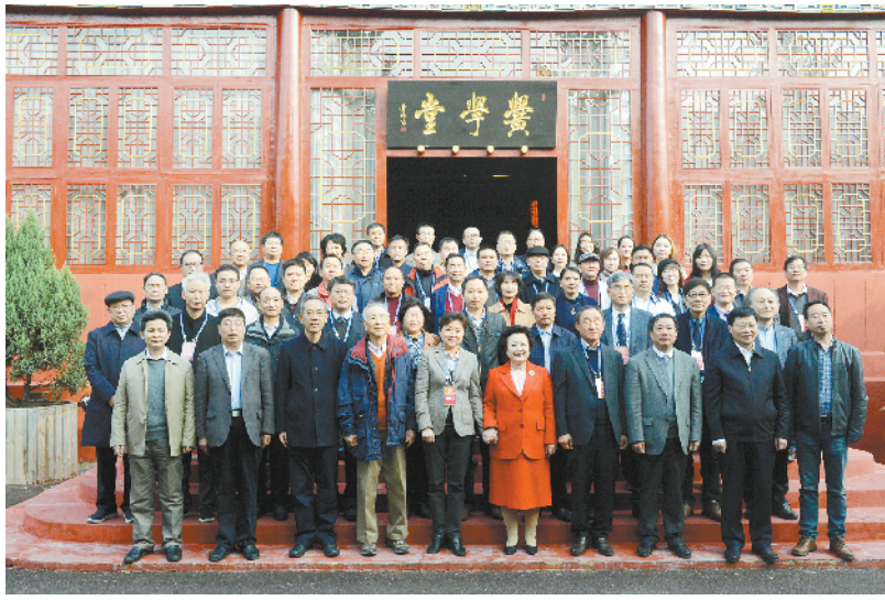
嘉宾们在鹿邑县黄学堂前合影留念。

发展具有重要的指导作用。老子著作是中国的一部百科全书,是中华思想史的源头和主干,对中华文化的形成和中国历史的发展,都产生了极为重要的影响。老子文化不仅是中华文明的根基,而且对全世界也产生了深远的影响;老子思想对现代经济发展、现代管理、现代科学的发展都具有重要的指导作用。对生态智慧、环境保护、社会冲突、人生处世、教育、现代宇宙空间学说、现代生物学、自然数生成理论等方面都有深刻的可资借鉴的现代