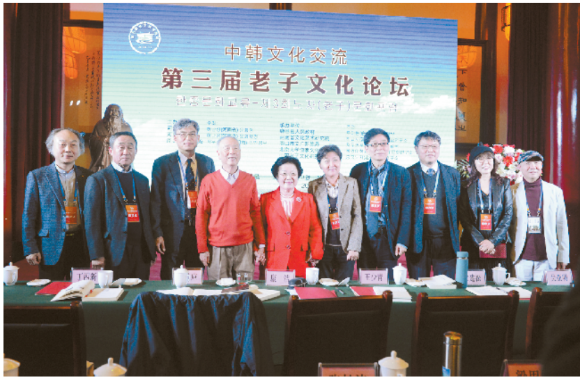
中韩文化交流第三届老子文化论坛现场。

本报讯(记者李瑞才文/图)11月11日,在老子故里鹿邑县黄学堂举办的第三届老子文化论坛上,来自中韩两国学者在论坛现场达成共识,并就老子文化发表了《鹿邑宣言》。