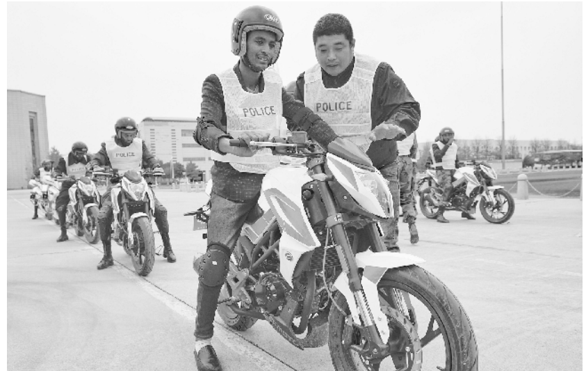
非洲警察北京学习警务驾驶

11月15日,来自埃塞俄比亚的警察在学习驾驶警用摩托车。当日,由公安部主办的2018年埃塞俄比亚警察培训班在中国人民公安大学开设警务驾驶课程。来自埃塞俄比亚的30余位警察进行了摩托车警务驾驶、护卫队形和警用全地形车驾驶等项目的训练。