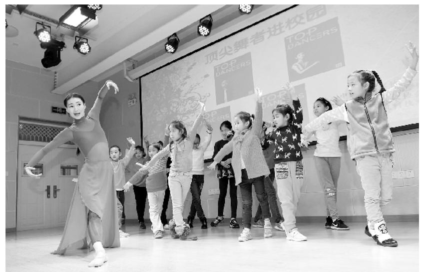
顶尖舞者校园团艺

据统计,截至10月30日,全国2963个县(市、区)已启动专项治理整改工作,其中1046个县(市、区)已基本完成专项治理整改任务。