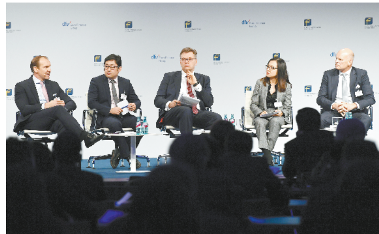
法兰克福欧元金融周举行“中欧银行日”活动

11月14日,在德国法兰克福,嘉宾在“中欧银行日”活动上参与专题讨论。作为第21届法兰克福欧元金融周系列活动之一,第五届“中欧银行日”活动当天在法兰克福展会会议中心举行。与会嘉宾重点围绕人民币国际化、中欧跨境投资、中欧资本市场合作等展开讨论。