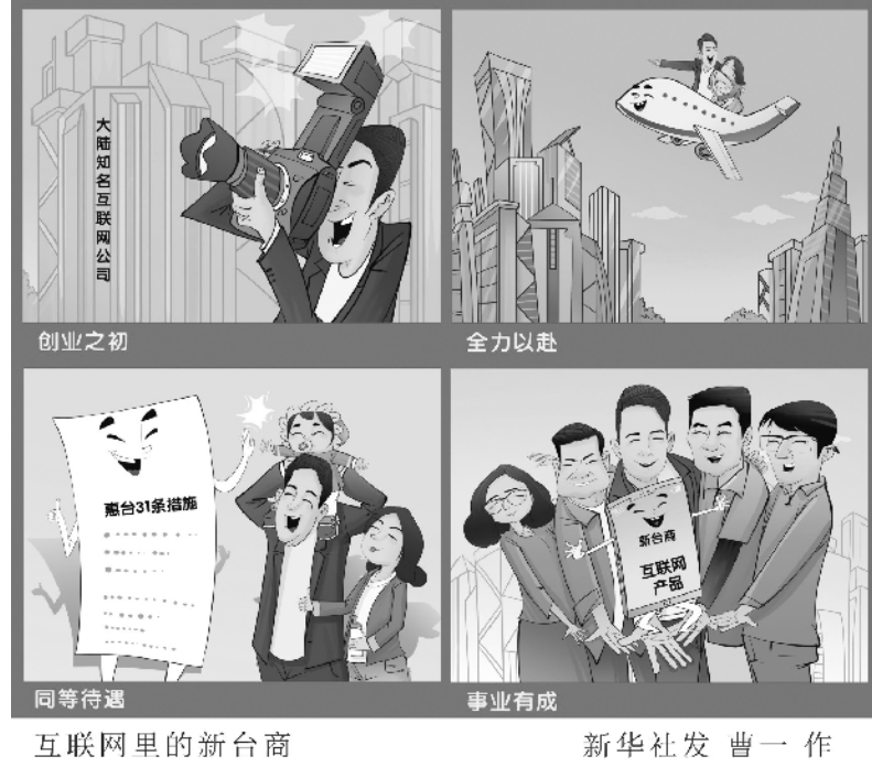
互联网里的新台商