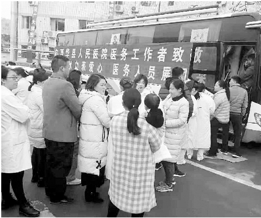
为缓解冬季用血紧张局面,12月3日,西华县人民医院组织医护人员参加无偿献血活动。据统计,当天共有 300 余人参加了义务献血活动。

发展提供医疗卫生技术研发,为周口职业技术学院医学专业建设及师生教育实习提供优质平台。 “双方正式牵手,开启了共商、共建、共享、共赢的新篇章。我们将不负使命、同舟共济、开拓创新,共同办好周口职业技术学院附属医院和周口协和骨科医院人才培训基地,为我市医疗卫生教育事业的发展作出新的更大的贡献。”周口协和骨科医院董事长张志平说。②9