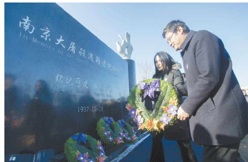
12月9日,在加拿大安大略省里士满希市,加拿大联邦国会华裔议员关慧贞(左)和谭斌为“南京大屠杀遇难者纪念碑”敬献花圈。

新华社多伦多12月9日电(记者李保东)加拿大华裔华人9日在安大略省里士满希市举行“南京大屠杀遇难者纪念碑”落成揭幕仪式,加拿大国会议员代表,加拿大联邦政府、安大略省和多伦多市代表,中国驻多伦多总领事及其他国家驻加使领馆官员、社团等各界代表共2000多人出席。