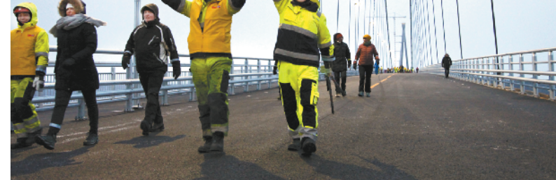
中企承建挪威第二大桥举行通车典礼

2017年6月5日,沙特、阿联酋、巴林、埃及四国以卡塔尔支持恐怖和破坏地区安全为由,宣布与卡塔尔断交,并对卡塔尔实施禁运和封锁。随后,又有多个国家宣布与卡塔尔断交或降低与卡塔尔的外交关系层级。卡塔尔今年12月3日宣布,从明年1月1日起退出石油输出国组织(欧佩克)。