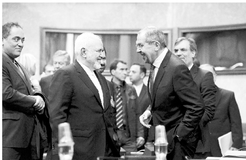
俄土伊将推动叙宪法委员会明年举行首次会议

中国白俄罗斯工业园管委会主任亚罗申科说，“中国速度”能够很好地诠释中国近年来取得的快速发展变化。白俄罗斯希望通过与中国共建中白工业园，以苏州工业园为蓝本学习借鉴中国改革开放经验，引进外国高新技术并在本国实现创新发展。