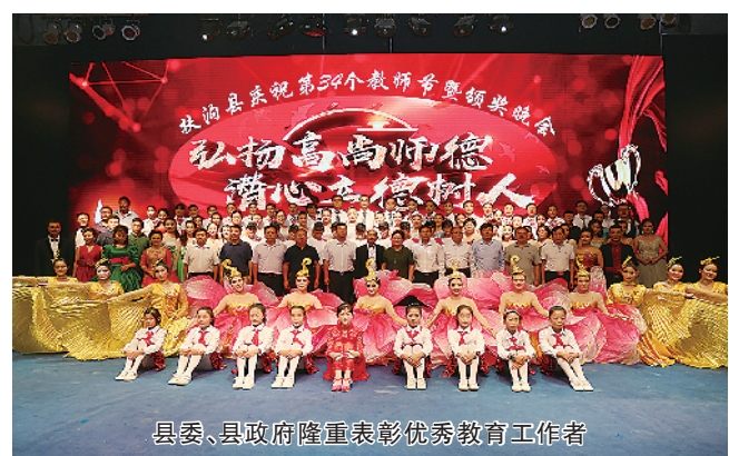
县委、县政府隆重表彰优秀教育工作者