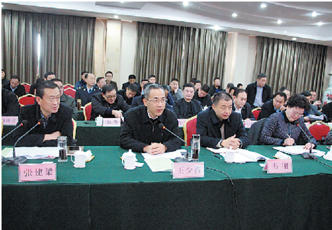
副市長王少青到扶沟調研義務教育均衡發展工作

滔滔贾鲁，神奇灵秀，皇皇大程，墨香四溢。位于豫东平原的扶沟县，一马平川，人杰地灵，尊师重教，由来已久。“乐诵读，俗善良，励家国”的优良传统孕育了程门立雪、何家“一母二进士”、吉鸿昌办学等动人故事，激励着一代又一代的扶沟人把培养学生作为头等大事、把教书育人视为崇高职业、把支持教育作为善行义举。