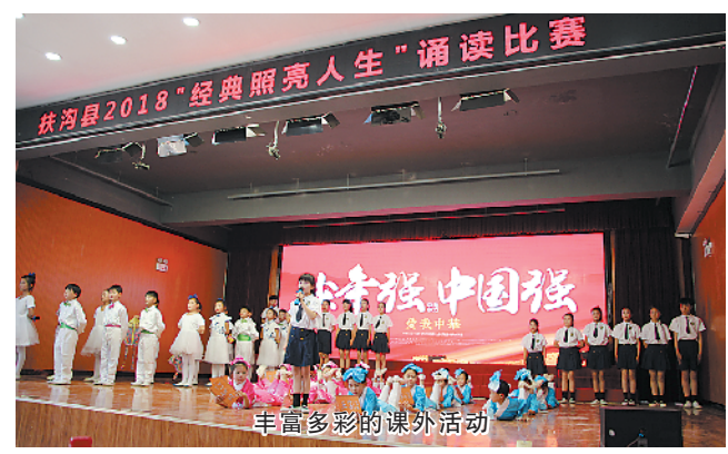
丰富多彩的课外活动