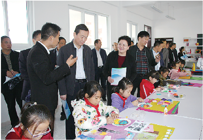
市教育局局长张建梁到扶沟调研教育工作

县直高中全体教职工凭务实求效的工作，不断创新，推动了全校教育教学工作实现新的跨越与腾飞。学校领导班子科学管理，班主任狠抓班风、学风建设，任课教师注意抓好高效课堂，抓好规范化、精细化特色教学，“131”高效课堂在平行班掀起课改高潮，卫星俄语班工作有序推进，做精做强郑州一中卫星班教育品牌，高考成绩连年取得新突破。2018年高招，一本上线35人，二本上线416人，创造了中招低分学生圆大学梦、重点梦的教育奇迹。2017年12月，在市教育局普通高中教育教学质量总结表彰会上，该校被评为“周口市普通高中教育教学质量先进学校”，该校