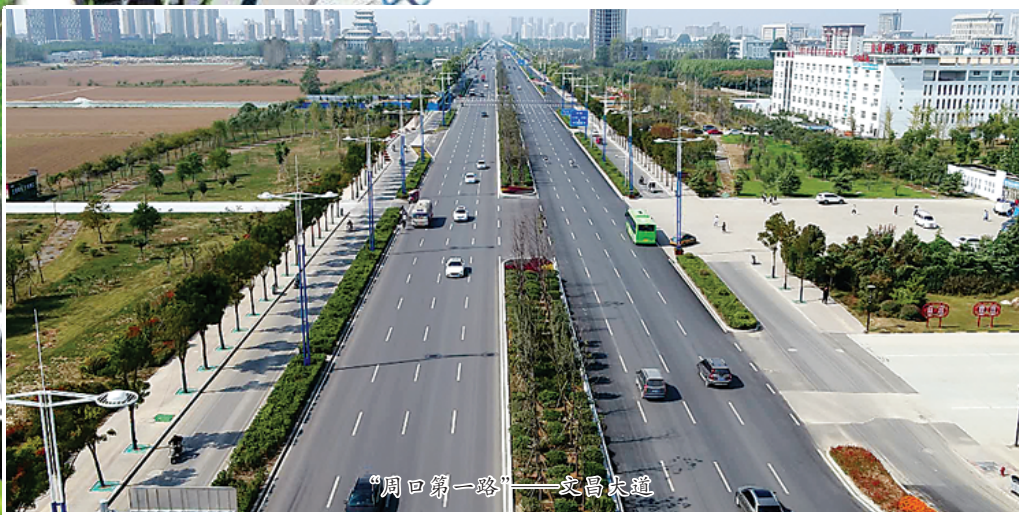
“周口第一路”——文昌大道