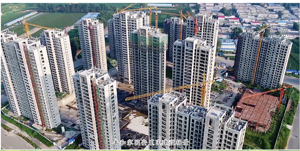
上海康桥公寓项目效果图