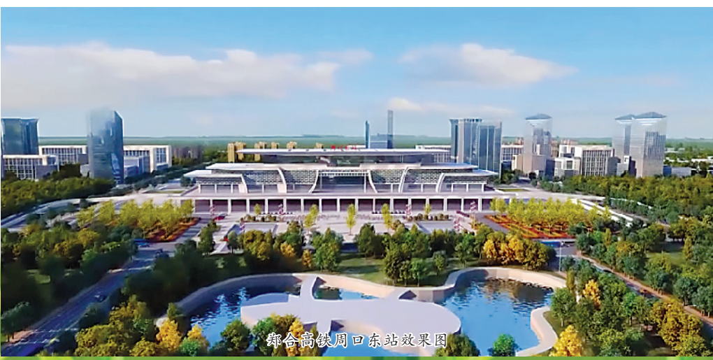
豫东新城周口东站效果图