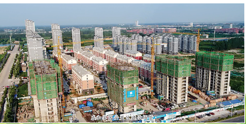
大梁湾安置房项目效果图