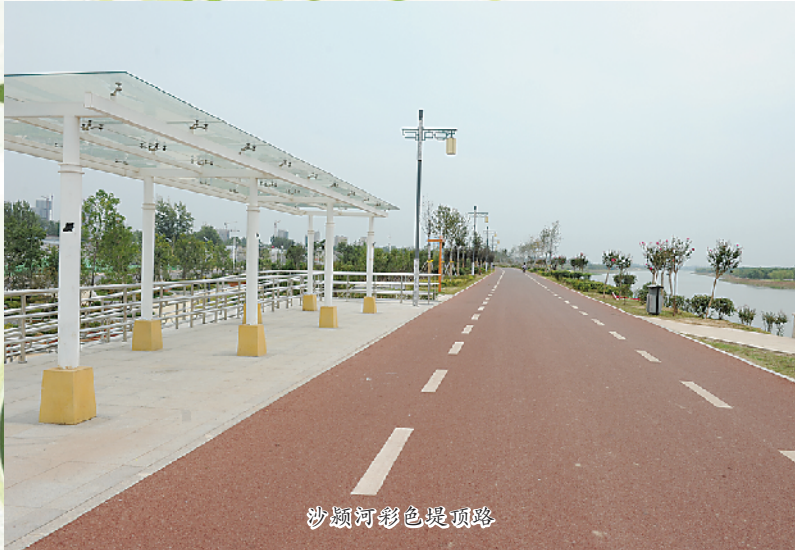
沙颍河彩虹桥效果图