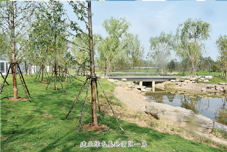
鹿邑绿色基地景区一角