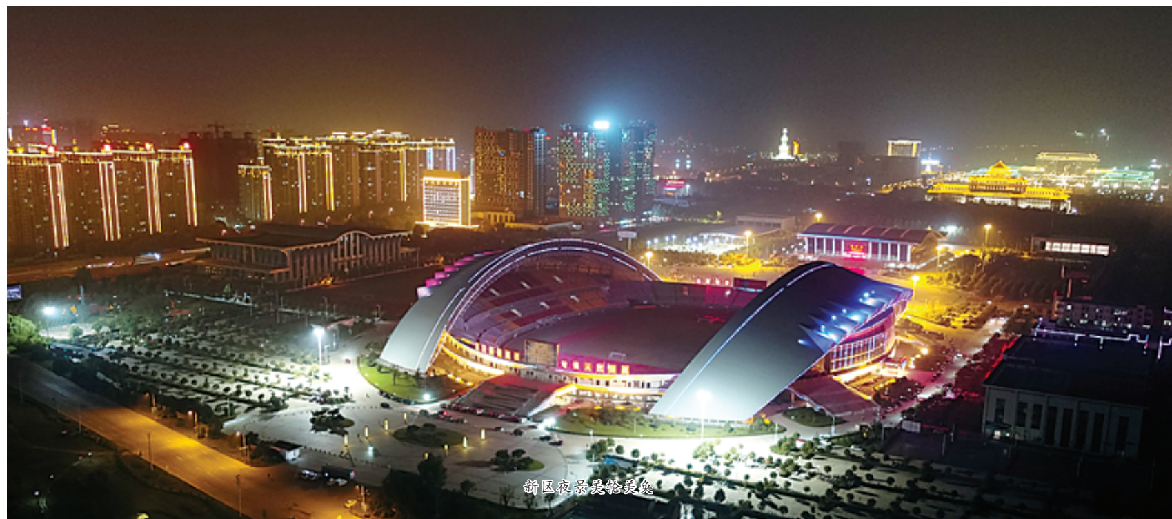
东新区夜景效果图

如今，东新区的项目集群已经产生了“万象更新、争奇斗妍”的奇观。引黄调蓄工程从开工到形成1500亩湖面，仅用了150余天时间，东新区创造了项目建设的传奇速度。记者了解到，该项目总占地7100亩，其中湖面