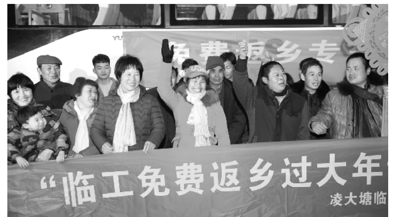
合肥：“爱心专车”送临工回乡

当天发布的数据还显示,2018年12月份,规模以上工业企业实现利润总额6808.3亿元,同比下降1.9%,降幅比11月份扩大0.1个百分点。