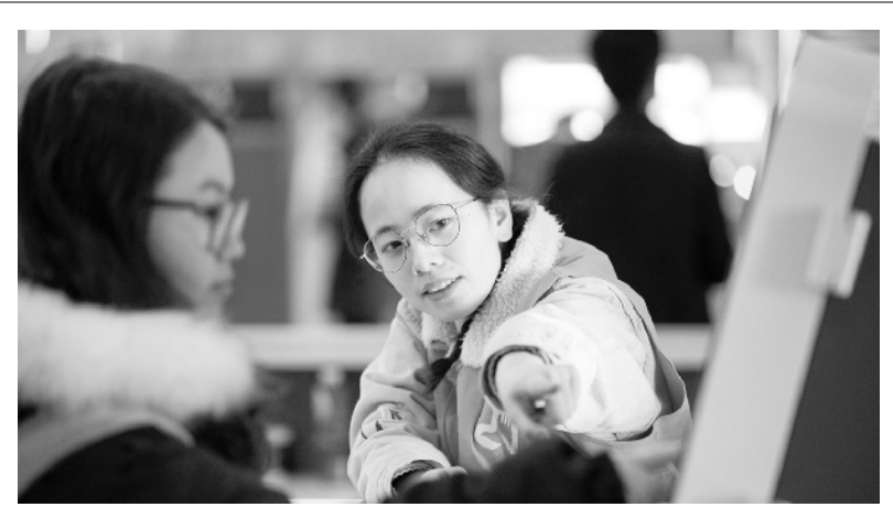
南京：“小甜橙”温暖返乡路

《通知》明确了提名评选程序,要求切实加强组织领导,精心部署安排。党和国家功勋荣誉表彰工作委员会负责国家勋章和国家荣誉称号提名评选工作的组织领导。各地区各部门党委(党组)要切实负起责任,精心组织,以高度的政治责任感做好相关工作。要把握正确方向,确保被提名人的先进性、代表性和时代性。要全面考核被提名人选一贯表现,以实际贡献作为重要评判标准,坚持公开公平公正,坚持群众路线,充分发扬民主,广泛听取各方面意见,好中选优。