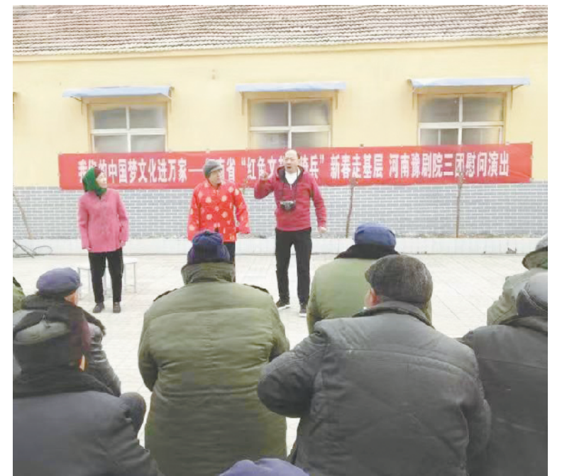
1月25日,河南豫剧三团的演职人员冒着严寒到郸城县李楼乡敬老院进行慰问演出。戏剧名家为老人带来了豫剧《朝阳沟》选段、小品《照相》等节目。②7