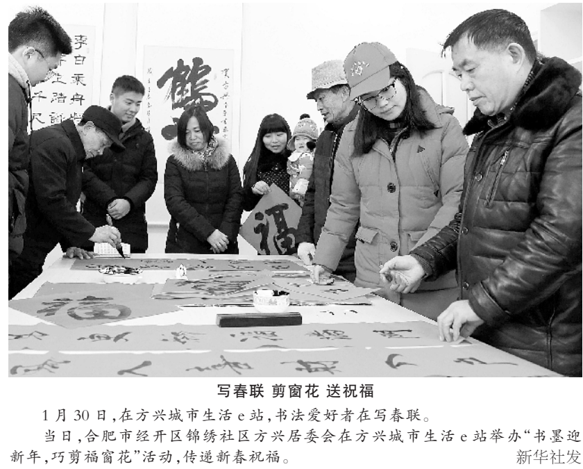
写春联 剪窗花 送祝福

2018 年全国共有 17264 人被终生禁驾 新华社北京 1 月 30 日电（记者 熊丰）公安部 30 日在京举行新闻发布会通报，2018 年，全国共有 17264 人被依法终生禁驾。其中，饮酒后或者醉酒驾驶机动车发生交通事故，构成犯罪的，有 5149 人；造成交通事故构成犯罪且有逃逸情节的，有 12115 人。 据统计，全年，在汽车增加 2285 万辆、驾驶人增加 2255 万人、道路通车里程新增 8.6 万公里的情况下，道路交通事故死亡人数同比 2017 年下降 0.9%，一次死亡 3 人、5 人以上事故下降 22.9%、14.9%，一次死亡 10 人以上重大事故发生 5 起，下降 44.4%，再创新低。 公安交警部门预计，今年将有 24.6 亿人次的客流量通过道路出行。面对今年首次大规模大范围的出行高峰，全国公安交通管理部门和广大交警、辅警已整装出发，守护亿万百姓的回家之路。 公安部提醒广大交通参与者，切实提高交通安全意识和文明意识，途经事故多发路段和车流密集路段时，谨慎驾驶，减速慢行；春运出行旅客要选择正规客运企业和具有营运资质的车辆，不坐超员车、超速车、疲劳驾驶车，远离酒驾毒驾；道路运输企业要切实履行交通安全主体责任，管好企业车辆和驾驶人，坚决清查清除安全隐患。