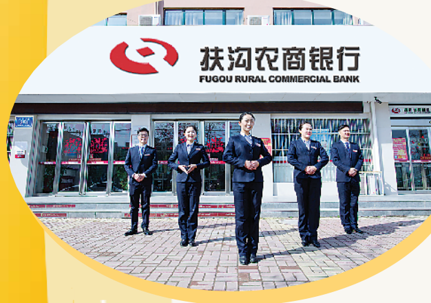
信守“四美”职业道德规范、“五讲”团队行为准则、“六修养”品行操守的扶沟农商银行员工。