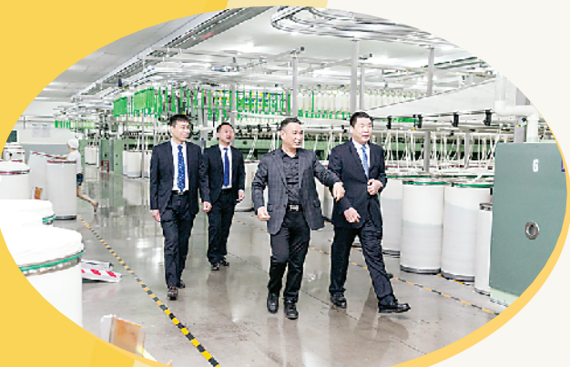
扶沟农商行以服务地方经济为导向,重点支持当地主导产业。