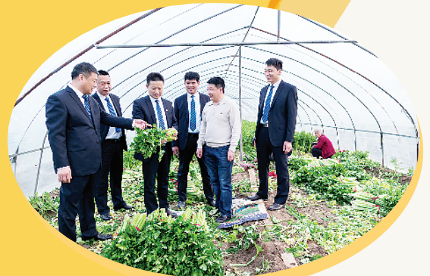
扶沟农商人深入了解客户需求,为乡村振兴提供强力金融支持。