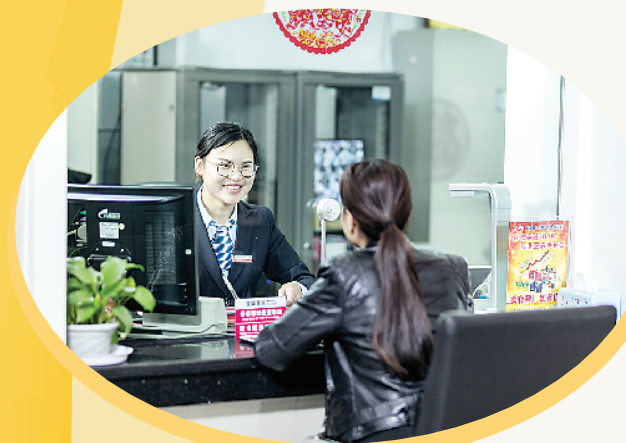
以诚心、爱心、专心、耐心、放心的“五心”为客户提供优质服务。