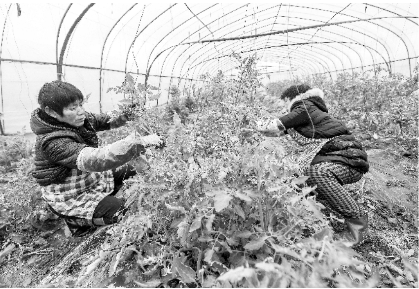
“人勤春早”农业基地春季养护忙

相关专家认为,这部《大熊猫志》重点记录大熊猫的神秘身世、物种特征、分布规律以及人类为保护、拯救、研究大熊猫的曲折历程,突出了四川省大熊猫保护工作的行业特色和时代特征,是一部用史实、事实展现大熊猫生活史、研究史、保护史、发展史、文化史的综合性书籍,极具历史价值和现实意义。