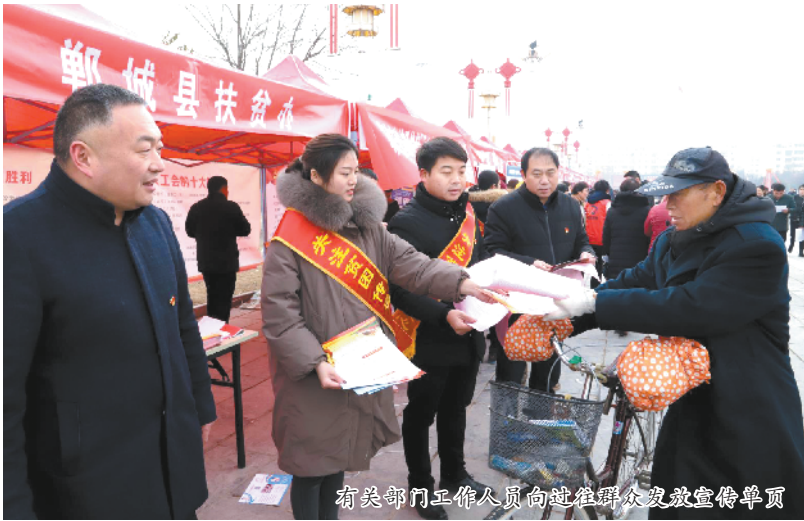
有关部门工作人员向求职者发放宣传单页

全面贯彻落实中央和省、市关于打赢脱贫攻坚战、促进创业就业的决策部署,扎实推进技能扶贫、就业扶贫、创业扶贫等工作,全年累计举办100多期各类培训班,培训5万多名技术人员,发放7000多万元创业担保贷款,扶持6800多名农民工返乡创业,带动12万人就业。 李全林强调,人才是地方经济发展的重要支撑。县委、县政府高度重视人才回乡创业就业,通过举办集中观摩活动、召开座谈会等方式,诚邀各类人才返乡创业就业,共建共享美好郸城。此次招聘会就是通过集中开展就