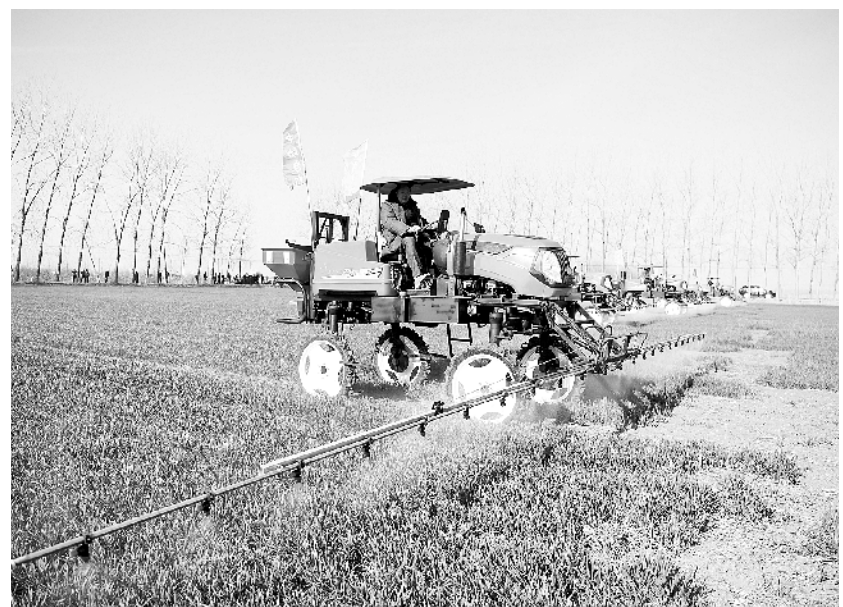
春来农事忙 3月7日,在安徽省五河县龙潭湖良种示范繁殖农场,农业机械在麦田喷洒农药。近日,江淮大地气温渐暖,安徽各地农民忙着春耕春管,田间地头一片繁忙。 新华社发

新华社郑州3月7日电(记者王烁)记者从河南省科技厅获悉,河南省加强科技企业孵化载体建设,助推“双创”高质量发展,截至目前,省级以上科技企业孵化器、大学科技园、众创空间等创新创业孵化载体数量达到364家。 据悉,2018年,河南省科技厅着力打造具有河南特色的“双创”升级版,河南省创新创业孵化载体实现量质齐升。据统计,截至2018年底,河南省各类孵化载体在孵企业和团队达2.2万余家,在孵企业和团队吸纳就业人数为22.9万余人,其中吸纳应届大学毕业生 21757人,占2018年应届大学生就业人数的5%,为河南省就业创业工作提供了有力支撑。 目前,河南省孵化企业涉及先进制造、电子信息、生物医药、航空航天、数字医疗、新材料、现代服务业、军民融合、新型能源、现代农业等10多个领域,孵化服务体系日益完善,发展规模不断壮大。 据了解,下一步,河南将继续加大对创新创业孵化载体的培育和支持力度,增强各类孵化载体的服务效能,为促进经济高质量发展提供支撑。