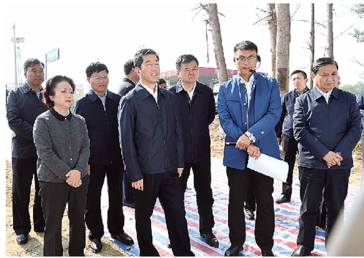
省、市领导到鹿邑调研引江济淮工程。

策划: 鹿邑县委 鹿邑县人民政府 周口报业传媒集团 统筹: 鹿邑县委宣传部 执行: 周口日报鹿邑记者站 李瑞才 图文支持: 闫广军 陈海棠 樊黎尹 任辉 胡洪涛等