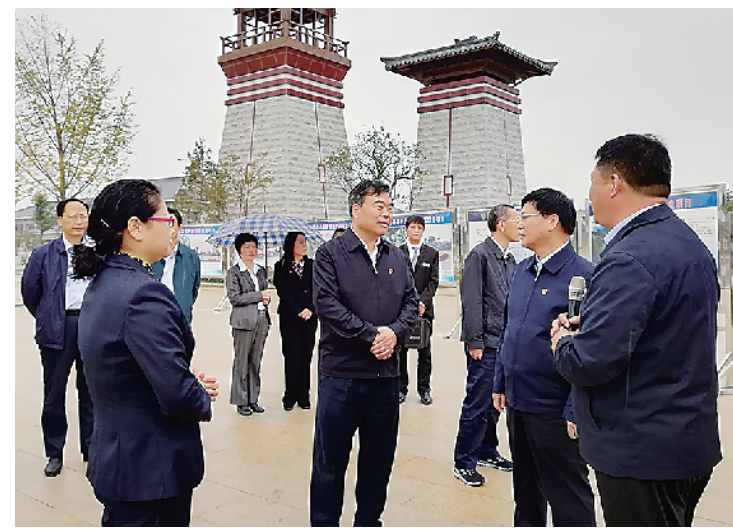
市委书记刘继带队到鹿邑观摩项目建设。

这里，是一块充满勃勃生机的投资沃土； 这里，是一座迸发着激情与活力的古城。 美丽三月，走进老子故里鹿邑，看到的是一幕幕火热的建设场面，处处散发着蓬勃向上、顽强拼搏的气息：企业生产车间里，机器轰鸣，工人忙碌；重点项目建设工地上，车辆往来，焊花四溅；招商战场上，干劲十足，捷报频传；国土绿化、环保攻坚开展得如火如荼，脱贫攻坚持续深入推进，一幅经济高质量发展新时代画卷在百万务实重干的鹿邑人民手中缓缓展开。