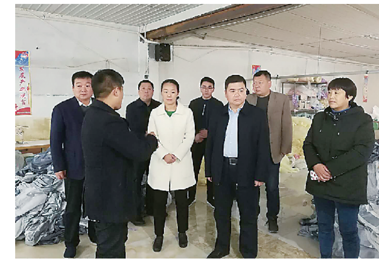
县长李刚到扶贫车间调研精准扶贫工作。