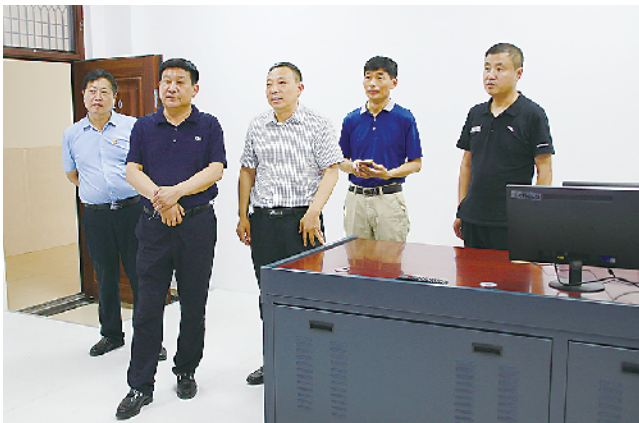
县长李锡勇到学校指导工作