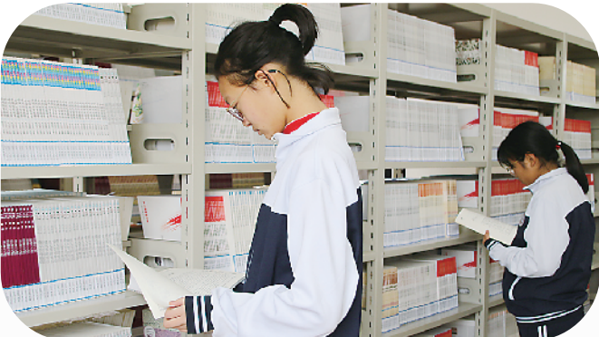
藏书20余万册的校图书馆

走进太康一高新校区(家印高中),高大的梧桐树、粗壮的银杏树与建筑物交相辉映,构成了一幅美丽的风景画。置身于大气磅礴、环境优美、书香浓郁的校园,有一种进入大学的感觉。 学校占地近600亩,总面积为36万多平方米,总建筑面积近12万平方米,由全国政协常委、恒大集团董事局主席许家印先生捐建。竖立在学校尚贤路旁的彩虹石上镌刻着《家印高中捐建事记》。“标准之高、速度之快,堪称奇迹……许家印先生热心公益、义举善行,励人奋进,史册彪炳!”《家印高中捐建事记》不仅记录了学校的建设过程及启用情况,而且表达了太康一高对许家印先生的感激之情。