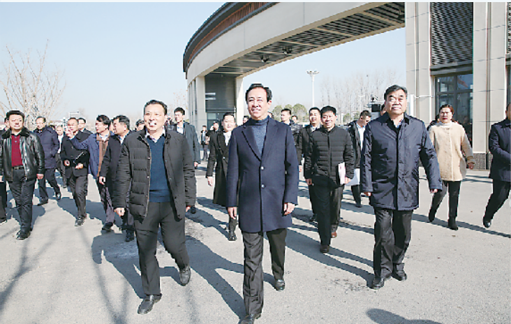
75届校友、恒大集团董事局主席许家印先生回母校考察

“再捐2.5亿元扩建家印高中!”2018年12月中旬,全国政协常委、恒大集团董事局主席许家印到太康一高新校区(家印高中)考察时掷地有声,并要求加快筹建,力争2019年9月份投入使用。 许家印先生情系家乡、造福桑梓的善举,再次引发了社会各界的赞誉。近日,迎着和煦的春风,踏着春天的节拍,记者一行走进了这所备受社会关注的学校——太康一高新校区(家印高中)。 行至106国道太康县城附近,远远望去,蔚蓝的天空下,一片独具现代化、国际化气息的建筑群显得分外吸睛,俨然一幅美丽的图画,这就是2017年11月投入使用的太康一高新校区(家印高中)。放眼四周,位于学校北侧的扩建项目工地上,塔吊林立,一辆辆工程车进进出出,工人们各自岗位上干劲十足,一派热火朝天的景象。