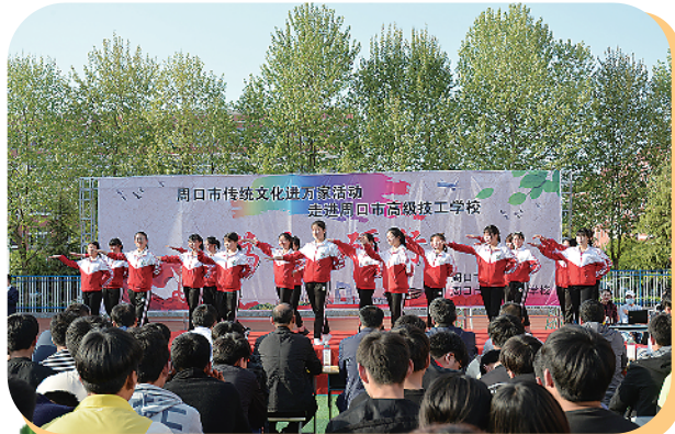
传统文化进校园活动