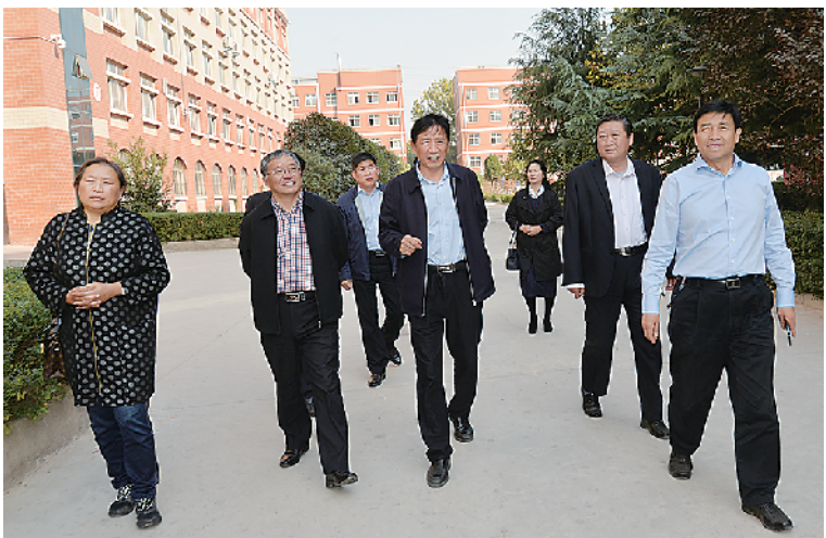
省人社厅相关处室负责人到校指导工作