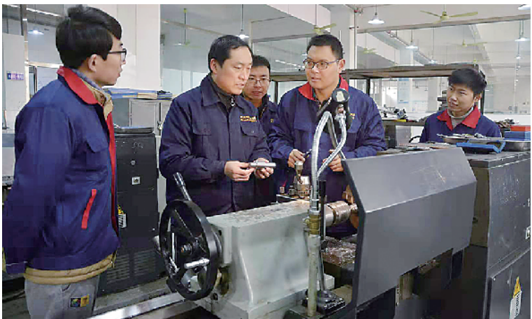
实训教学演示活动