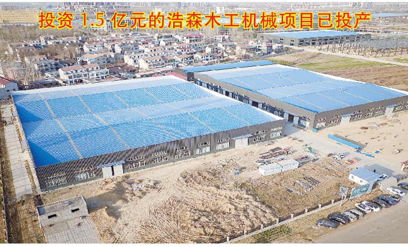
投资 1.5 亿元的浩森木工机械项目已投产

项目占地约 125 亩,总投资 9 亿元,集儿童游乐、购物休闲、生物驯养、科普教育及海洋生物展览等于一体,并包含海洋馆、海洋旅游及商业用房等。项目建成后,主题馆共分 11 个展(区)馆,将展示 600 多个品种、5 万余尾世界各地珍稀的海洋、淡水生物,是集观赏性、科普性、趣味性、知识性、娱乐性于一体的大型海洋公园。 目前,海洋生物展示馆等 11 个场馆主体封顶,计划“十一”试运营。