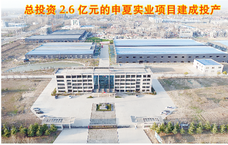
总投资 2.6 亿元的申夏实业项目建成投产

项目占地约 65 亩,总投资 5 亿元,总建筑面积 3.9 万平方米。项目以淮阳姓氏文化为依托,以荟萃中原传统美食小吃为主要经营业态,能满足游客的住宿、购物、娱乐需求,是为太昊陵、龙湖、中华姓氏博物馆配套的民俗风情专题式体验旅游景区。 目前,项目主体已完工,正在进行二次结构施工,6 月底竣工。