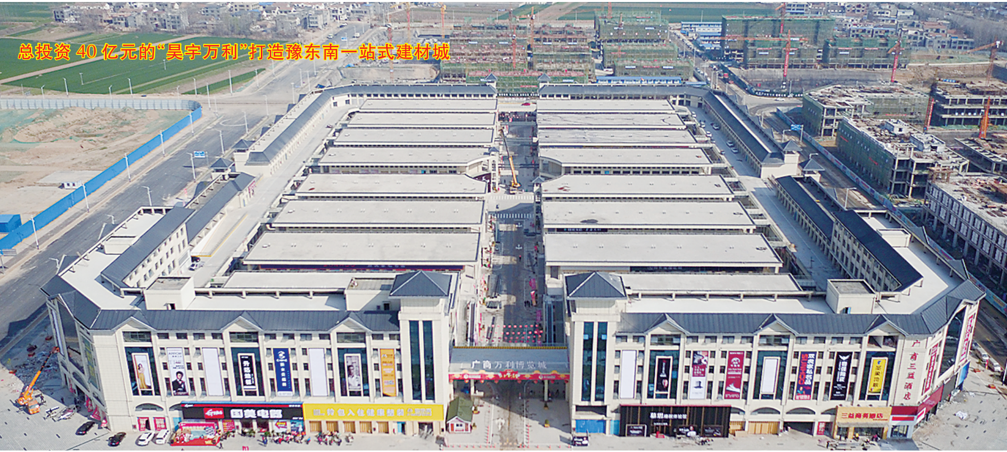
总投资 40 亿元的“吴宇万利”打造豫东南一站式建材城

S324 (文昌大道至韩城南环路)淮阳段全长 20.17 公里,途经王店、刘振屯、冯塘 3 个乡镇,14 个行政村,占地 1531.56 亩,预算总投资 3.47 亿元。按照双向四车道一级公路标准进行设计,路面宽度 23 米,设计时速 80 公里。2017 年 8 月底淮阳县启动征迁,2018 年 12 月,工程已建成通车。