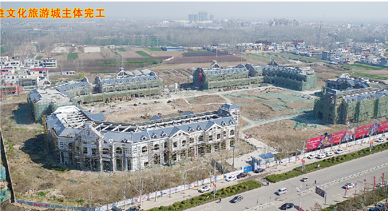
总投资 5 亿元的偃家姓文化旅游城主体完工

案由: 《关于提升中心城区城市文化品位的提案》 提案人: 王卫华 提案内容: 我市城市建设中的文化景观不多,没能形成具有周口特色的“城市名片”,而且一些很有文化内涵的街道或以行业命名的街道随着旧城改造的推进,已经或正在消失。建议突出城市科学规划,为城市未来发展打下良好基础;强化单体建筑设计,构建城市建筑的韵律美、整体美、和谐美;建设一批具有文化品位、体现城市特色、展现历史底蕴的文化街、文化园、文化墙、文化角;对在旧城改造中拆除的老街道、名称应予以保留,使周口传统的地名文化得以传承。