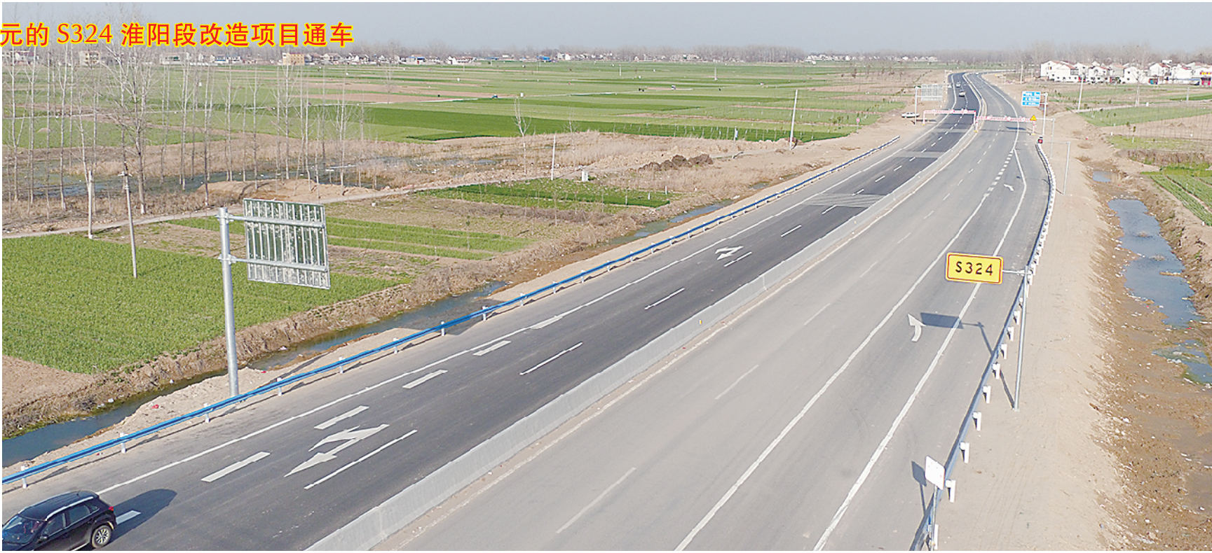
总投资 3.47 亿元的 S324 淮阳段改造项目通车

S324 (文昌大道至韩城南环路)淮阳段全长 20.17 公里,途经王店、刘振屯、冯塘 3 个乡镇,14 个行政村,占地 1531.56 亩,预算总投资 3.47 亿元。按照双向四车道一级公路标准进行设计,路面宽度 23 米,设计时速 80 公里。2017 年 8 月底淮阳县启动征迁,2018 年 12 月,工程已建成通车。