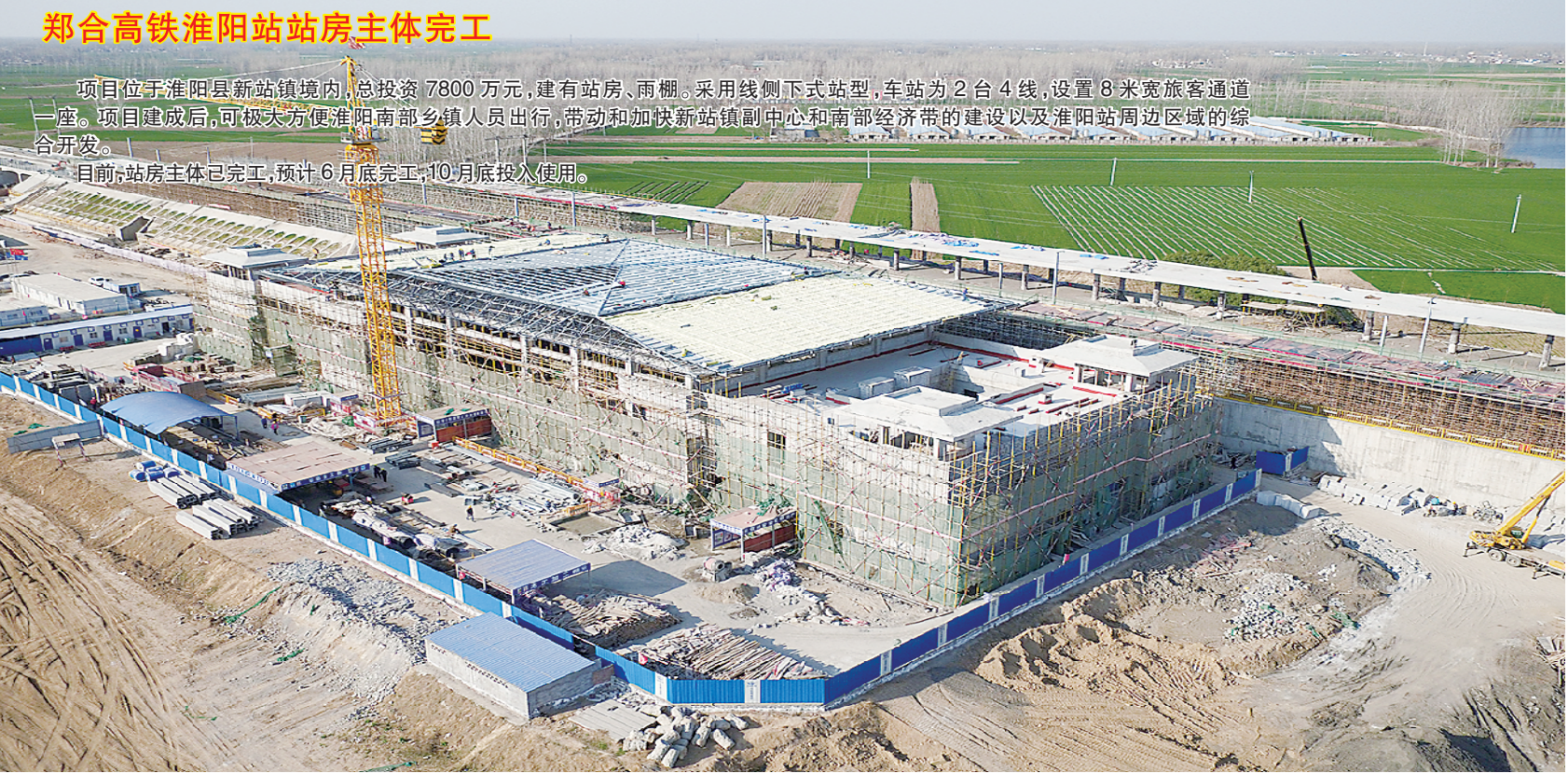
郑合高铁淮阳站站房主体完工

项目位于淮阳县新站镇境内,总投资7800万元,建有站房、雨棚,采用线侧下式站型,车站为2台4线,设置8米宽旅客通道一座。项目建成后,可极大方便淮阳南部乡镇人员出行,带动和加快新站镇副中心和南部经济带的建设以及淮阳站周边区域的综合开发。