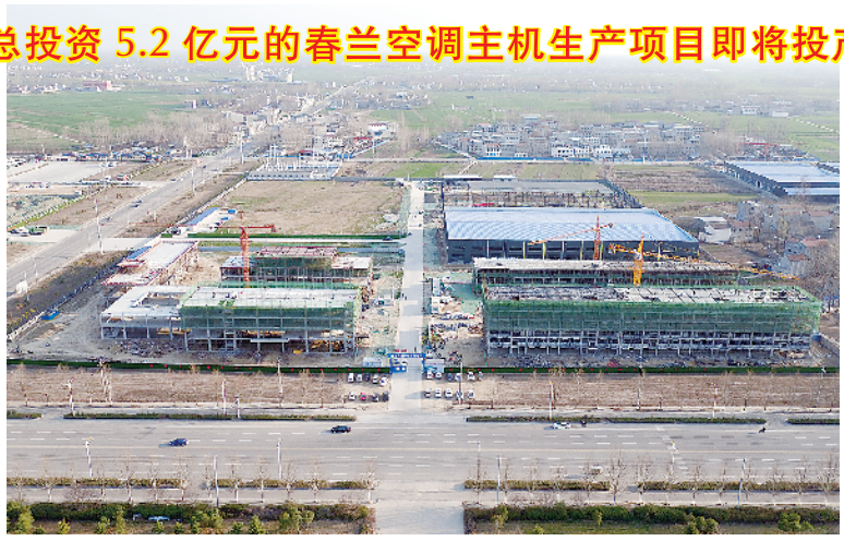
总投资 5.2 亿元的春兰空调主机生产项目即将投产

项目占地约 150 亩,总投资 5.2 亿元,主要生产新型环保型、节能型中央空调主机,包括水系统末端组件、氟系统末端组件、智能控制系统。建成投产后,当年销售额可达 1.2 亿元,利税可达 1000 万元,可安排 450 人就业。目前,车间主体、办公楼、研发中心等已完工,5 月安装设备,6 月试生产。