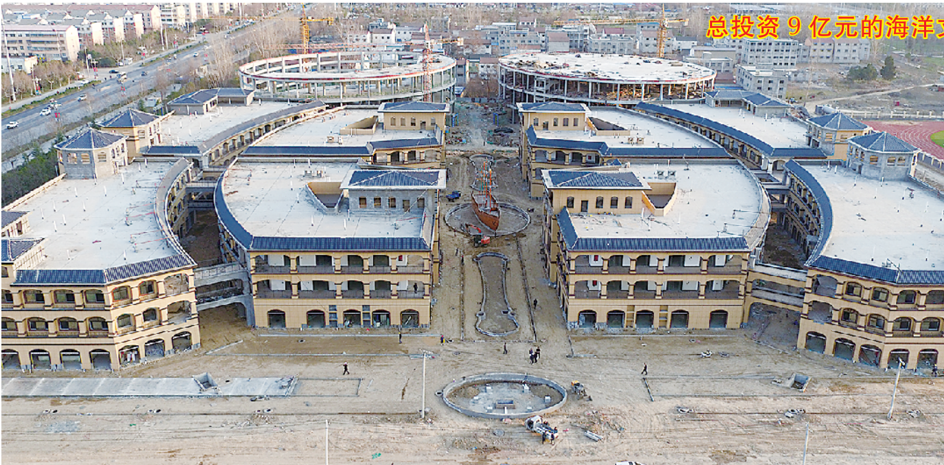
总投资 9 亿元的海洋文化公园快速推进

项目占地约 130 亩,总投资 2.6 亿元,公司专业研制燃气用铜铝转换接头,主要生产天然气管件系列产品,且集研发、制造、销售于一体,是省级科技创新型企业、国家级高新技术企业。年销售额达 2 亿元,利税达 2000 万元,为 200 人提供就业岗位。