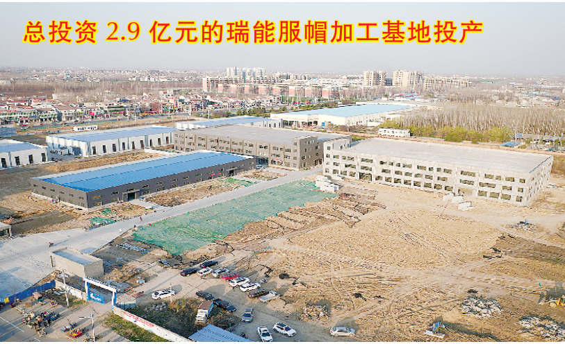
总投资 2.9 亿元的瑞能服帽加工基地投产

项目占地 107 亩,总投资 2.9 亿元,主要建有厂房、办公楼、科研楼、餐厅、宿舍等。项目建成投产后,年产量可达 3000 万顶服帽,可解决 3000 余人的就业问题,年产值可达 5 亿元,外贸出口创汇可达 3000 万美元,可实现利税 4000 万元以上。目前,项目一期已建成投产。