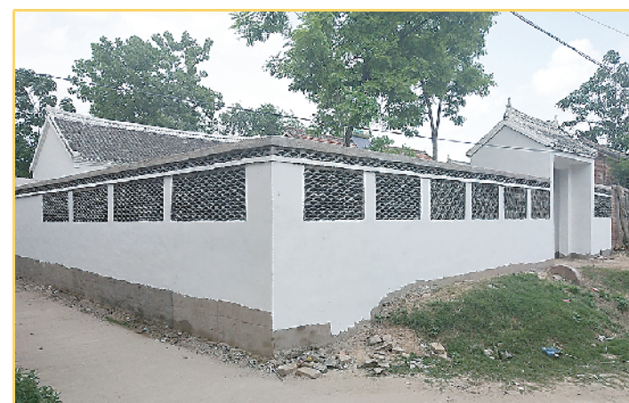
“六改一增”扮靓贫困家庭