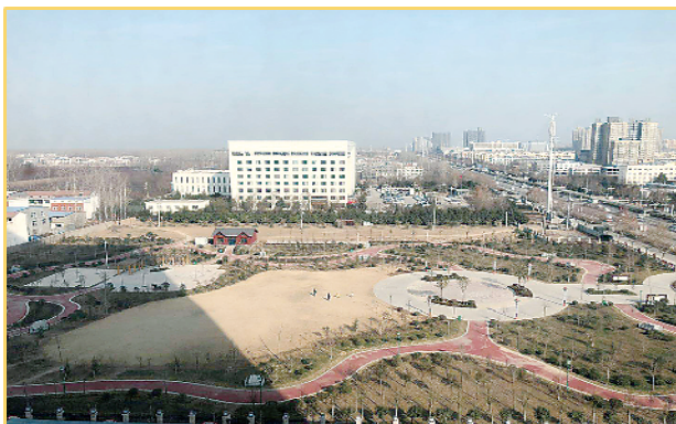
新落成的育才公园