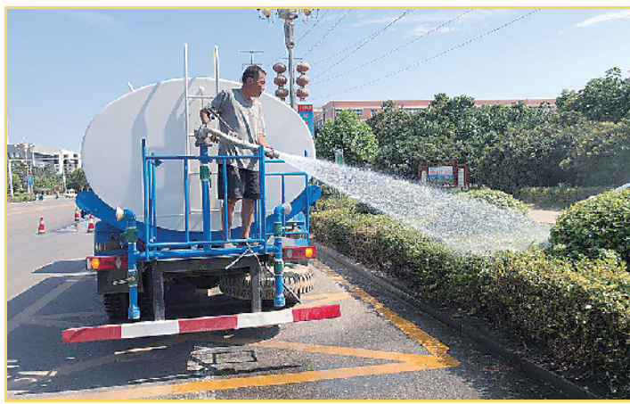
园林工作人员定期冲洗绿化带

潮平两岸阔，风正好扬帆。站在新起点，淮阳县住建系统将持续推进全县城乡建设，进一步提升淮阳的城市形象和品位，为打造一座幸福、美丽而有活力的城市再作新的贡献。