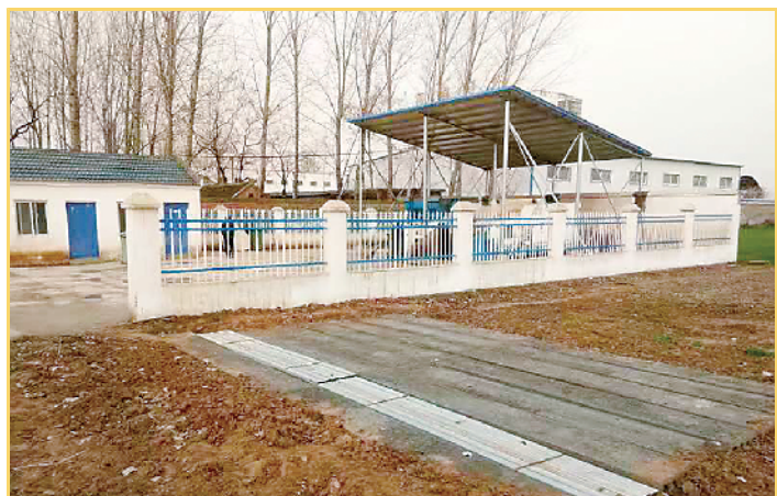
各乡镇均建起垃圾中转站