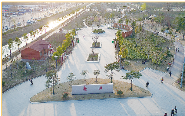
新建的廉园廉政文化教育氛围分外浓

为进一步加强生态文明建设,改善生态环境,2018年,淮阳县实施城区黑臭水体治理项目2个,分别是徐老庄沟和北关沟,治理河道长度5.1公里,总投资9200万元。目前,徐老庄沟已铺设污水管网550米,北关沟项目正在进行房屋和土地征收,这两个项目计划2019年底前完工。