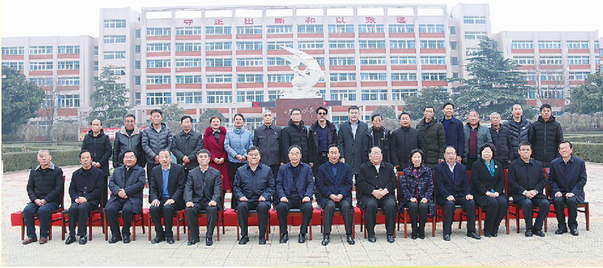
许家印到学校视察

春天,一切都是新的。在市委、市政府和市教育局的大力支持下,有恒大集团和许家印先生的关心呵护,学校的全体师生定当■力同心、奋勇拼搏,书写“周口恒大中学”大气大成的教育新篇章。我们有理由相信,“周口恒大中学”的未来一定会更加美好!