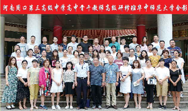
骨干教师赴华中师大培训