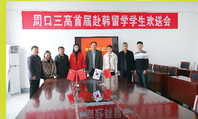
赴韩留学学生欢送会