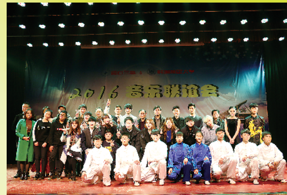
与韩国檀国大学联谊会