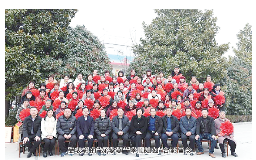
受表彰的“好婆媳”“孝顺媳妇”合影留念。