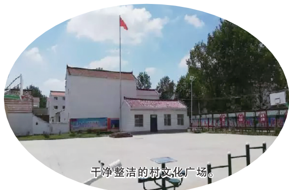
干净整洁的村文化广场。