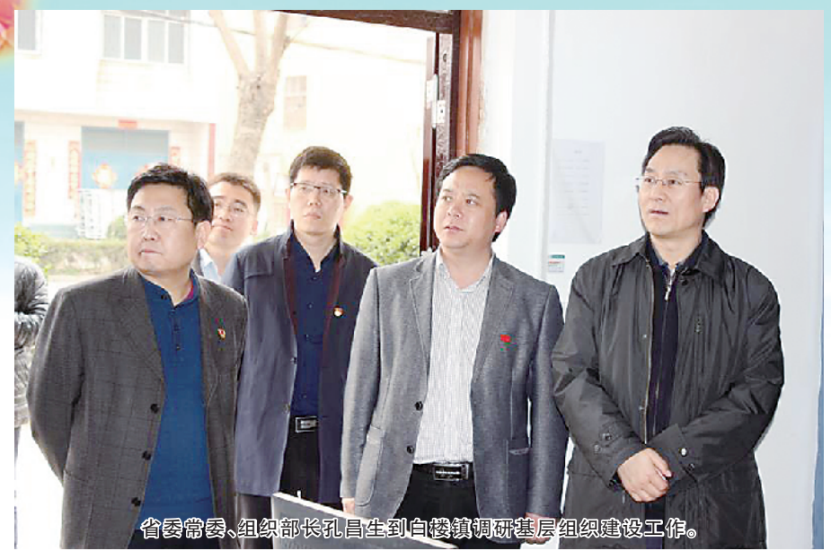
省委常委、组织部长孔昌生到白楼镇调研基层组织建设。