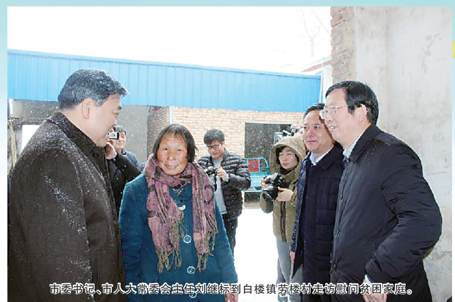
市委书记、市人大常委会主任刘继标到白楼镇劳楼村走访慰问贫困家庭。

2018年以来,在淮阳县委、县政府的正确领导下,白楼镇党委和政府充分发挥党委的政治核心作用,基层党组织的战斗堡垒作用,把“六村共建”和实施乡村振兴战略作为新时代工作的总抓手,抢抓机遇,开拓创新,奋力前行,农村经济建设、政治建设、文化建设、社会建设、生态文明建设和党的建设均取得新成效。 处处生机勃勃的白楼镇先后获得全国百县千乡万村无邪教创建先进单位、全国民主法治示范村2个国家级荣誉,以及省级文明镇、省级卫生镇、省级卫生先进单位、省人民调解先进集体、省级文明村镇5个省级荣誉。