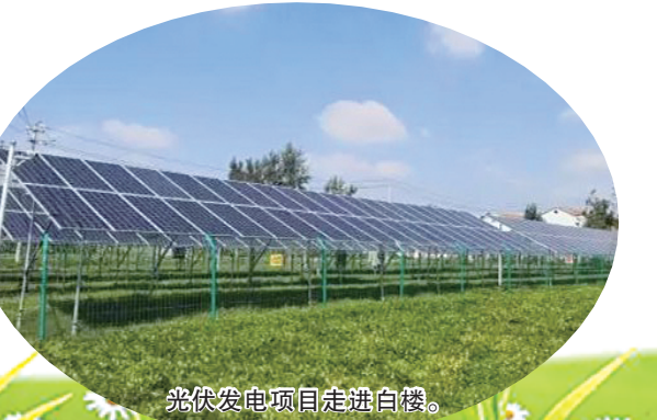
光伏发电项目走进白楼。