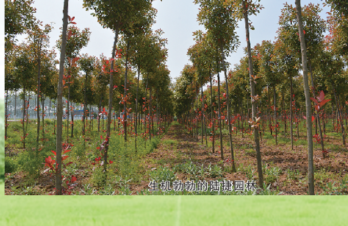
生机勃勃的庭院经济