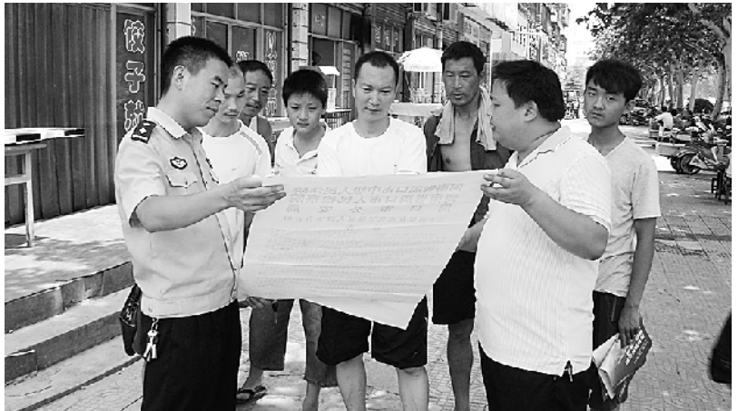
民警走进社区,宣传发动群众积极检举涉黑涉恶违法犯罪线索。