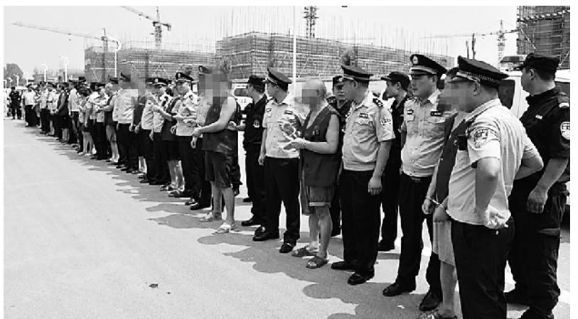
涉黑犯罪嫌疑人指认犯罪现场。

开展为期三年的扫黑除恶专项斗争,是以习近平总书记为核心的党中央作出的一项重大决策部署。 号令即出,动若风发。 在市委领导下,我市全面贯彻落实党中央、省委部署,高位谋划、强力推进,全民动员、众志成城,迅速统筹各方力量,吹响了这场斗争的“集结号”。 2018年2月1日,全市扫黑除恶专项斗争电视电话会议召开,认真传达学习全国扫黑除恶专项斗争电视电话会议精神,部署推进扫黑除恶专项斗争工作,全面打响了全市扫黑除恶专项斗争。 市委及时成立了由政法委牵头、市直35个成员单位参加的扫黑除恶专项斗争