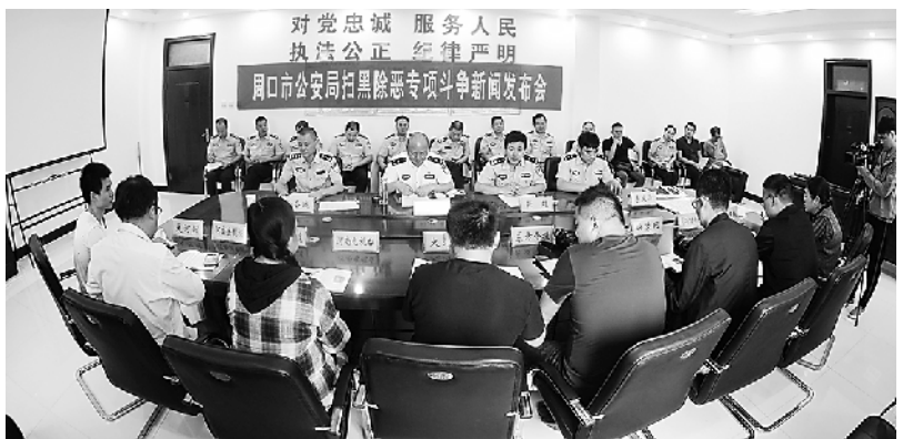
市公安局召开新闻发布会,通报扫黑除恶专项斗争开展情况和战果。