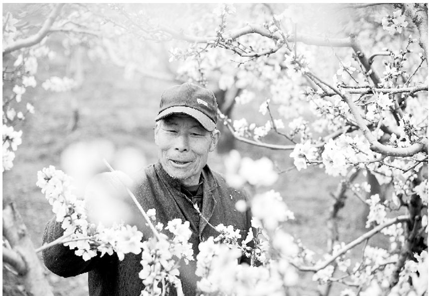
山东:三月春暖农忙 3月29日,山东省枣庄市山亭区水泉镇东垆城村农民在果园为桃花授粉。正值山东各地进行春季田间管理的大好时期,农民抢抓农时忙碌在田间地头,一派春意盎然、生机勃勃的景象。

会议要求,各级党委(党组)要高度重视党员教育管理工作,加强对《中国共产党党员教育管理工作条例》实施的组织领导。各级组织部门要发挥牵头抓总作用,相关职能部门要加强协调配合,形成工作合力。党支部要履行好直接教育党员、管理党员、监督党员的职责,不断提高党员教育管理工作水平。会议还研究了其他事项。