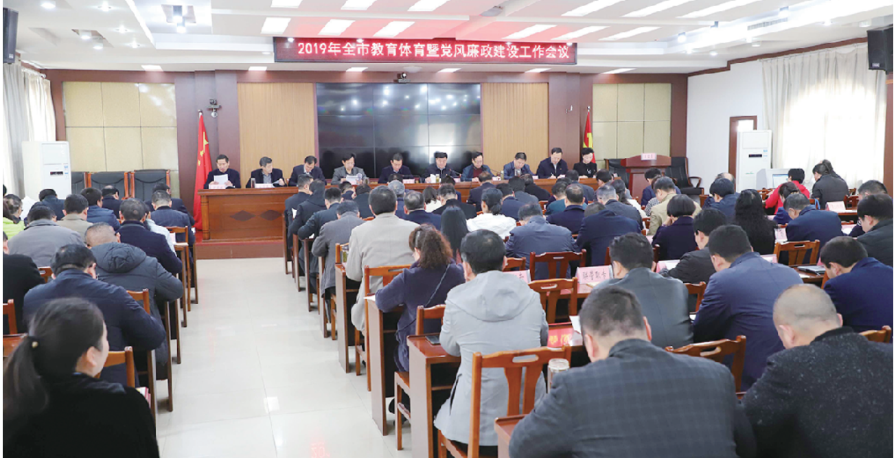
2019年全市教育体育暨党风廉政建设工作会议召开。

★高中教育提质量 实施高中阶段教育普及攻坚计划和消除大班额专项规划,着力改善普通高中办学条件,化解普通高中大班额问题。