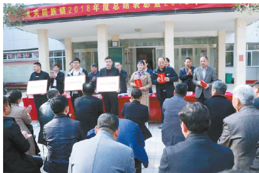
4月7日上午,太康县城关回族镇召开2018年度总结表彰暨2019年工作动员大会。全镇干部职工、社区“两委”班子成员、新风协会会员、驻镇站所负责人,以及受表彰的纳税先进企业和纳税先进个人参加会议。