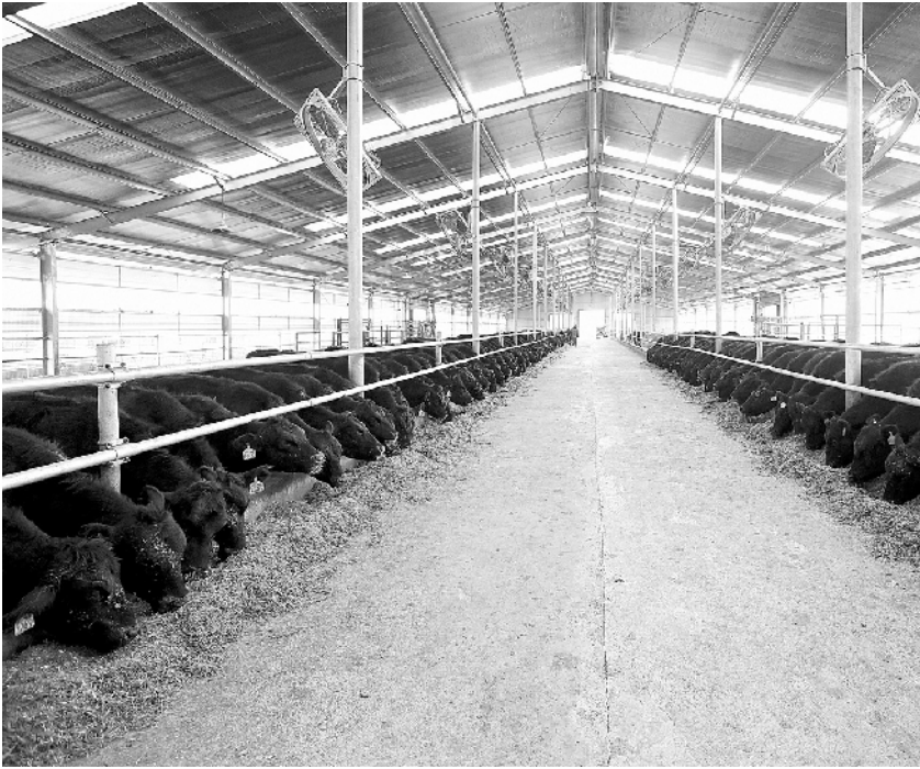
恒大在毕节援建的纯种安格斯牛育种场