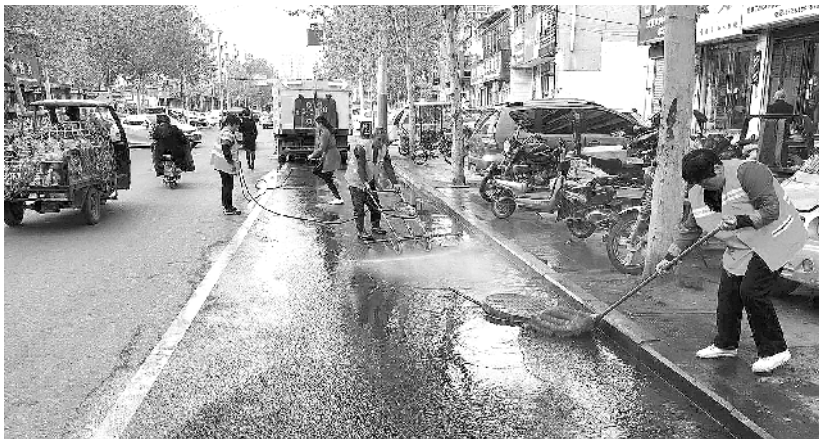
连日来,川汇区城管局在城区主干道路全面推广湿法冲洗保洁模式,大力推进道路清扫保洁机械化作业,全面提升道路清扫保洁标准。