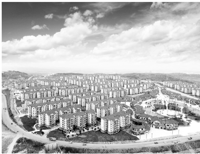
恒大在黔西建设的“移民搬迁社区”