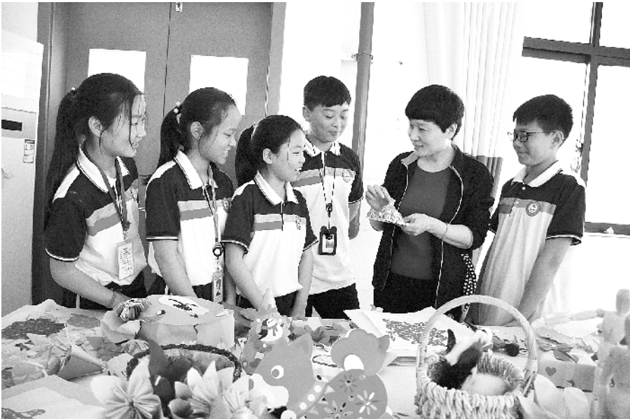
在推进素质教育过程中，沈丘县各中小学开设剪纸、书法、绘画、音乐等校本课程，提高学生的动手能力、实践能力，增强创新意识。图为思源实验学校老师在美术课上教学生手工制作。

立周口品牌形象。 活动中，市市场监管局质量科负责人作了主题为《品牌建设与管理》的讲座，为大家讲述了在新形势下如何加强品牌建设，提升品牌意识、品牌理念、品牌声誉等，得到与会人员的一致好评。 据介绍，“中国品牌日”活动期间，市市场监管局还将开展向企业寄发“加强品牌建设推动高质量发展公开信”，印发《质量提升纲领性文件汇编》等系列活动。①6