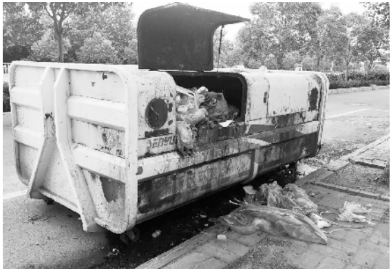
5月12日,垃圾桶周围依旧污水横流垃圾散落。