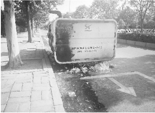
5月10日,垃圾桶周围污水横流垃圾散落。