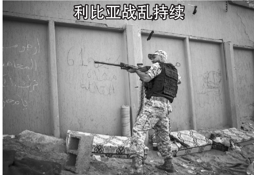
这是5月18日在利比亚首都的黎波里拍摄的一名支持利比亚民族团结政府的武装人员。东部军事领导人哈夫塔尔麾下的“国民军”自4月初开始发起西进攻势,在的黎波里郊外与支持利比亚民族团结政府的军事力量交火。