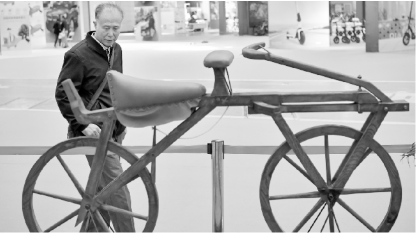
山西太原:博览会上的自行车

根据报告,我国孕产妇死亡率稳步下降,2018 年较 1990 年下降 79.4%;城乡差距明显缩小,城市与农村孕产妇死亡率之比由 1990 年的 1:2.2 降至 2018 年的 1:1.3。此外,2018 年新生儿死亡率、婴儿死亡率和 5 岁以下儿童死亡率较 1991 年降幅均超过 80%。