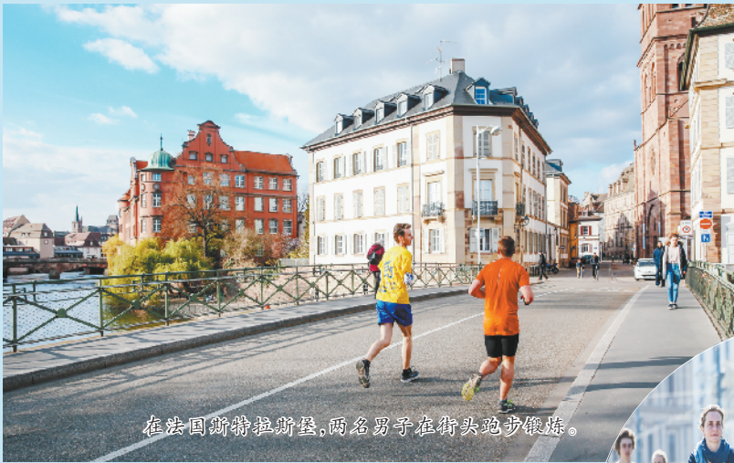
在法国斯特拉斯堡,两名男子在街头跑步锻炼。