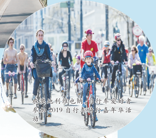
在奥地利维也纳,自行车爱好者参加2019年自行车嘉年华活动。