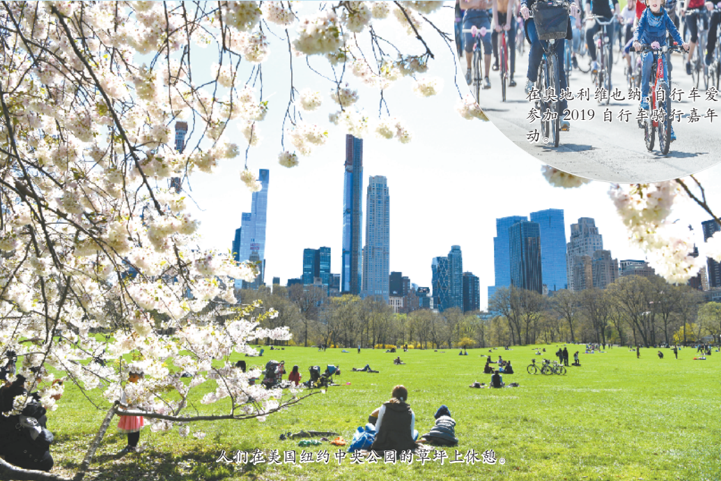
人们在美国纽约中央公园的草坪上休憩。