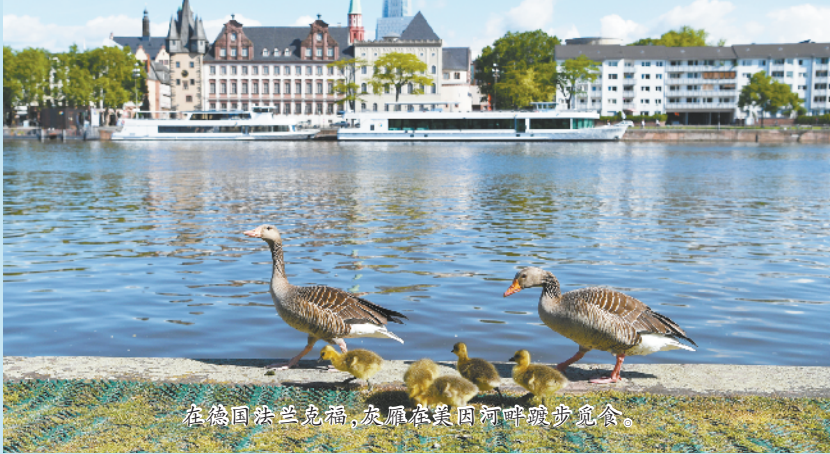
在德国法兰克福,灰雁在莱茵河畔散步觅食。