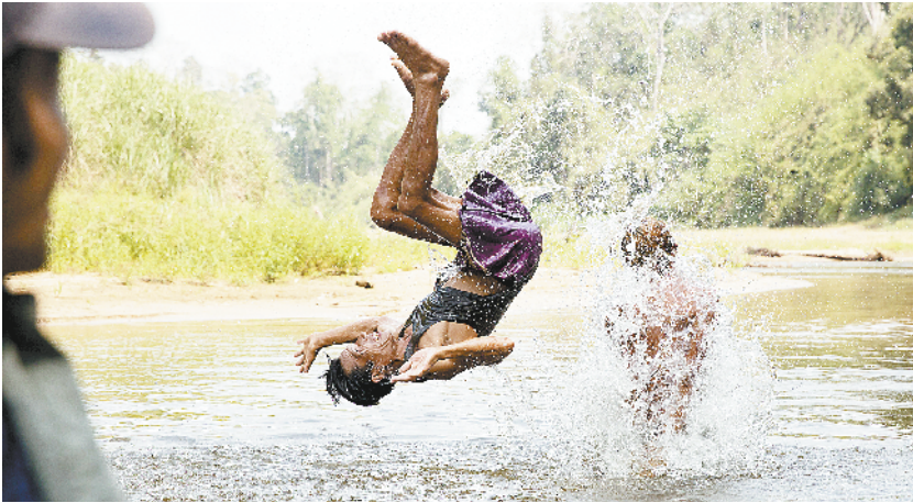
缅北人的传统生活

这名发言人说,过去一年间,朝鲜为建立新型朝美关系、构建朝鲜半岛持久稳定和平机制、实现朝鲜半岛无核化,付出了持续努力,主动采取了一系列实践举措,但令人遗憾的是,美国在过去一年间有意回避履行朝美共同声明,一味要求朝方单方面弃核,意欲以实力扼杀朝鲜的企图越发露骨。