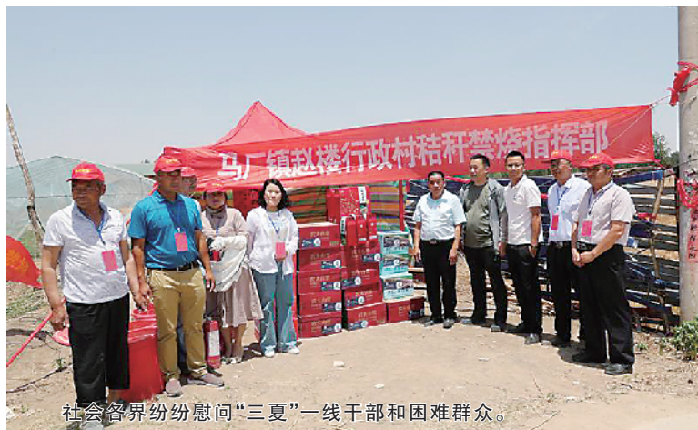
社会各界纷纷慰问“三夏”一线干部和困难群众。