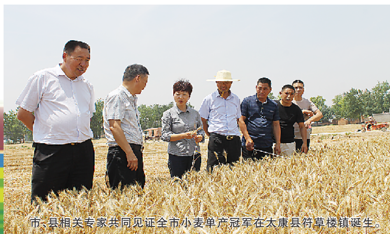
市、县相关专家共同见证全市小麦单产冠军在太康县符草楼镇诞生。

民以食为天,国以粮为安。今年3月8日,习近平总书记参加十三届全国人大二次会议河南代表团审议时强调,要扛稳粮食安全这个重任。