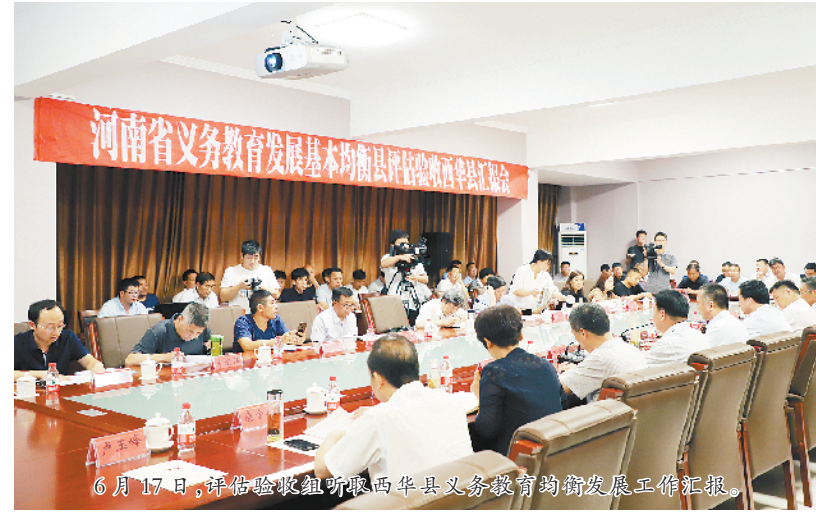
6月17日,评估验收组听取西华县义务教育均衡发展工作汇报。

本报讯(记者 张洪涛 文/图)6月17日至21日,省义务教育发展基本均衡县评估验收组莅临我市,对西华县、太康县、淮阳县、鹿邑县义务教育均衡发展工作进行评估验收。