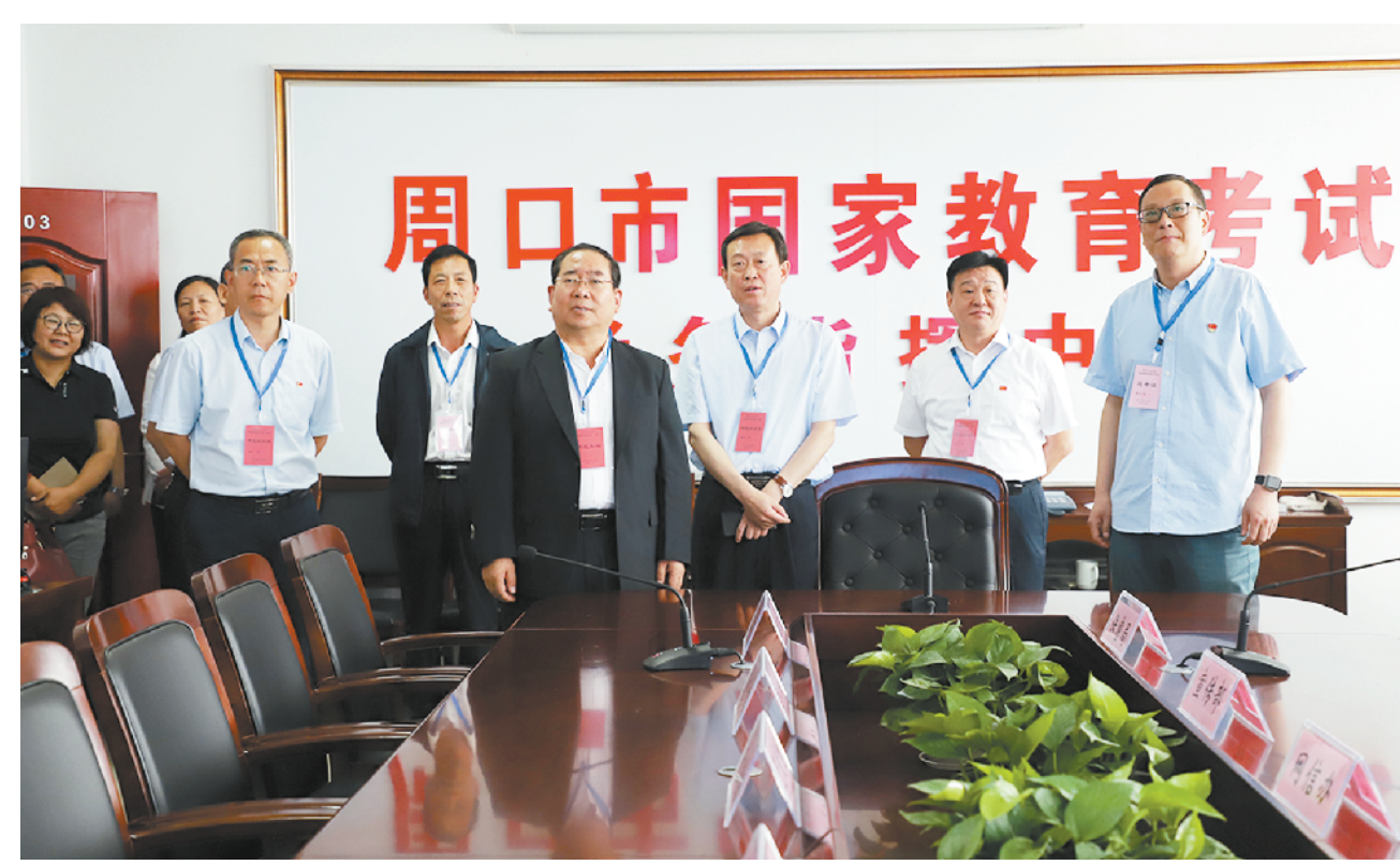
工作,全市未出现一例违规违纪现象。

一年一度的普通高等学校招生全国统一考试(以下简称“高考”)关乎国家选才,情牵万千家庭,是国计,是民生。 市委、市政府历来重视高考工作,把高考当作重要民生工程来抓,主要领导亲自过问,多次听取高考工作汇报,在全市营造了浓厚的舆论氛围。6月5日,市委书记刘继标对2019年全市高考安全工作做出批示:要切实抓好高考安全工作,实现省政府提出的“三零四不”目标。 高考期间,市教育体育局严格按照刘继标书记的要求,坚持依法从严治考,着力优化服务,打造平安高考、和谐高考、诚信高考、人文高考,顺利实现了“三零四不”目标。 至此,在这场有82229名考生参加、近万名社会爱心人士参与的大考中,三川大地书写了一份让全市人民满意的优秀答卷。