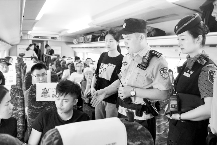
武汉铁路警方开展“列车霸座”处置演练 7月17日，武汉铁路公安局举行实地演练，针对影响群众安全感的列车霸座、扒阻车门、倒卖车票、醉酒滋事、拒绝安检、恶意逃票、损坏车站设备、阻碍民警执法和妨碍铁路工作人员履行职务等社会治安问题和违法犯罪行为，展开规范化处置执法教学演练。

新华社北京7月17日电 记者施雨岑)故宫博物院近日推出包括“数字文物库”在内的多款数字产品，借助先进的技术手段，挖掘数字文物新价值。据介绍，“数字文物库”在公开186万余件藏品基本信息的基础上，首批精选了5万件高清文物影像进行公开。未来这个数字还将不断刷新，满足故宫文化爱好者和专家学者欣赏、学习、研究文物的需求，也将为文物保护工作提供支撑。