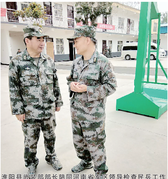
淮阳县武装部部长陪同河南省军区领导检查民兵工作

革命老区军爱民,红色沃土拥军。兵员大县淮阳,如今正在为国防建设输送一批又一批优秀儿女,在强军征途中,打造出“军民一家亲”的鱼水深情,演绎着强军的慷慨乐章!