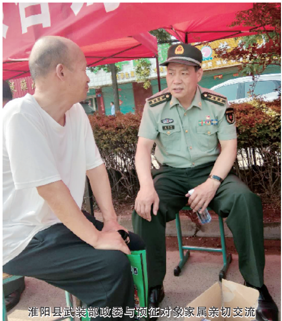
淮阳县武装部政委与预征对象家属亲切交流