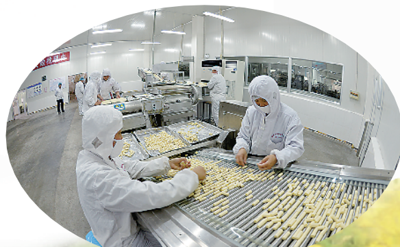
金丝猴奶糖生产车间一角