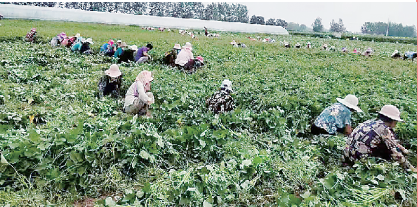
太康县龙陶家庭农场的员工在采摘蔬菜