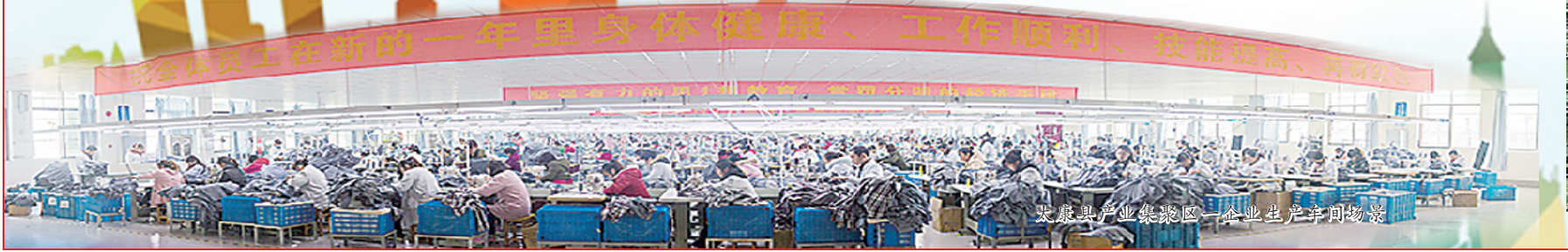
太康县产业集聚区企业生产车间内