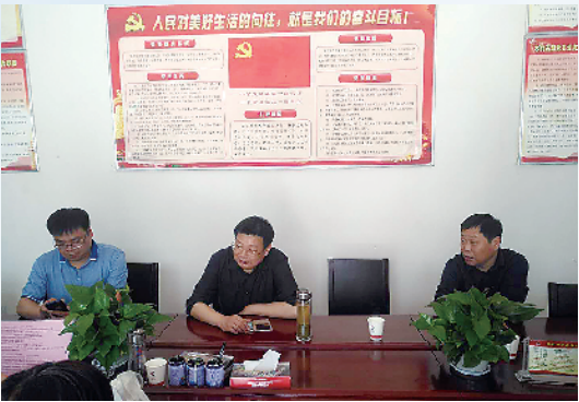
沈丘县常务副县长郝四春到商务中心区检查指导工作