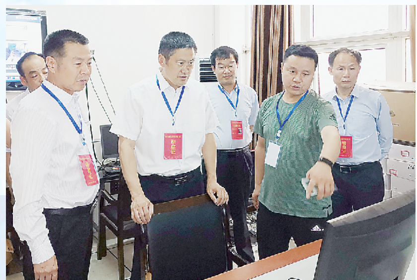
县长王毅到陈州高中调研教育教学工作