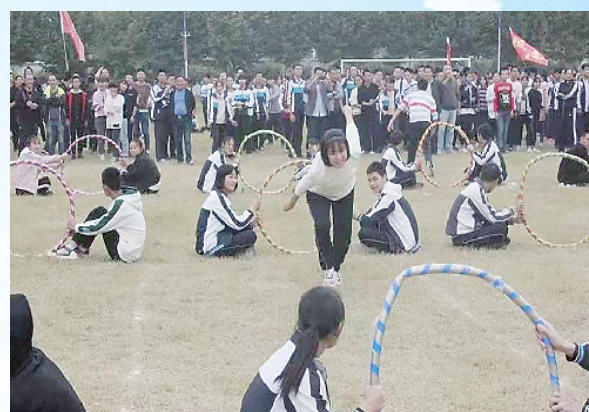
丰富多彩的文体活动