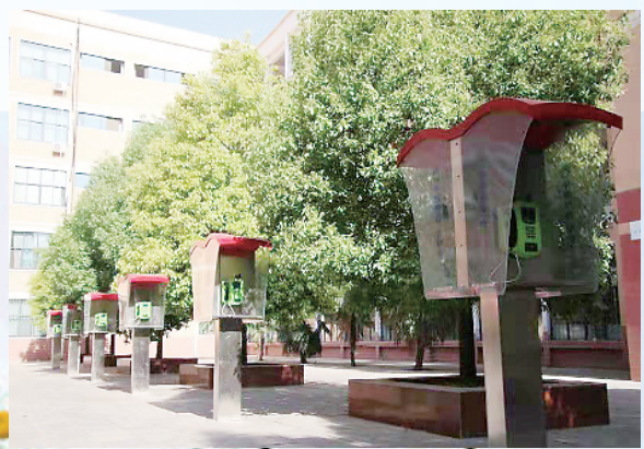
井然有序的校园一角