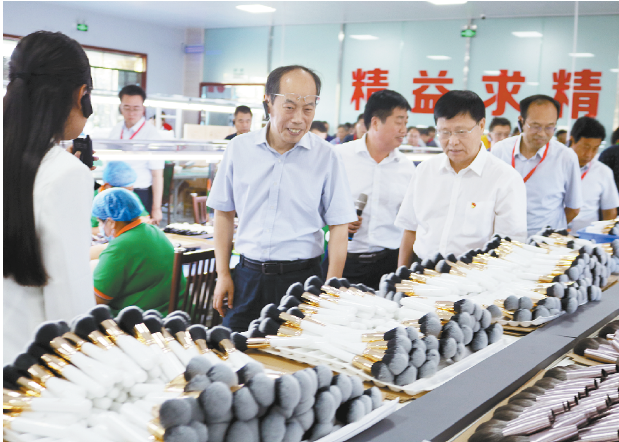
与会人员到河南海新化妆用具股份有限公司观摩。

据了解, 鹿邑是全国最大的化妆刷生产基地, 被中国轻工业联合会评为“中国化妆刷之乡”。鹿邑目前外出务工人员返乡达 8.3 万人, 创办各类实体数量 3.2 万个, 带动就业 18.2 万人; 截至 2018 年年底, 已落地化妆刷生产加工企业 131 家, 年产值达 39 亿元, 产品远销欧洲、美洲等 20 多个国家和地区。②3