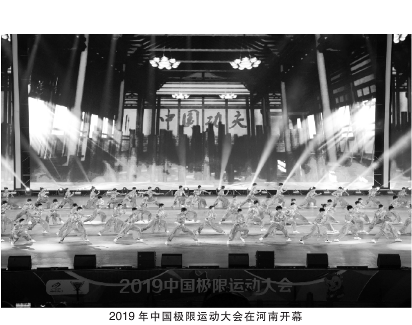
2019 年中国极限运动大会在河南开幕 8 月 18 日,演员在开幕式上进行文艺表演。当日,2019 年中国极限运动大会开幕式在河南省濮阳市清丰县举行。

新华社北京 8 月 19 日电(记者 张辛欣)由中国汽车工程研究院股份有限公司、北京理工大学电动车辆国家工程实验室、清华大学电池安全实验室、新能源汽车国家大数据联盟联合发起的中国新能源汽车评价规程近日在京发布,从 3 个维度 20 余项指标对新能源车进行评价测试。测试表明我国新能源车发展良好,但仍存在续航、密封能力有待加强等问题。 中国新能源汽车评价规程从能耗、安全、体验 3 个维度设置包括电池故障率、里程信赖等 20 余项测评指标,综合反映车辆性能,并对主流车型样本进行研究测试。 测试结果发现,目前新能源汽车在全球统一轻型车测试循环下的常温、高温续航里程和能量消耗率都处于较好水平,但也存在低温工况下里程衰减、纯电动车高速行驶能力不足等问题,车辆密封性能亟须加强。 工信部有关负责人提出,将进一步加快完善新能源汽车整车、动力电池和充电基础设施安全标准,提升新能源汽车全生命周期的质量安全水平,同时不断提高新能源汽车产业创新能力。