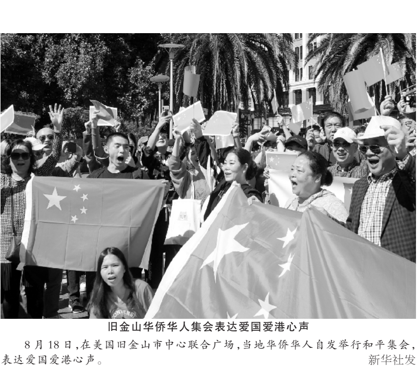
旧金山华侨华人集会表达爱国爱港心声 8 月 18 日,在美国旧金山市中心联合广场,当地华侨华人自发举行和平集会,表达爱国爱港心声。

新华社北京 8 月 19 日电(记者 施雨岑)教育部 19 日发布公告称,2020 年全国硕士研究生招生考试初试时间为 2019 年 12 月 21 日至 12 月 22 日,超过 3 小时的考试科目在 12 月 23 日进行。 公告提示说,硕士研究生招生考试报名包括网上报名和现场确认两个阶段。所有参加硕士研究生招生考试的考 生均须进行网上报名,并到报考点现场确认网报信息、采集本人图像等相关电子信息,同时按规定缴纳报考费。 公告称,考生应在规定时间登录“中国研究生招生信息网”进行报名,按要求准确填写个人网上报名信息并提供真实材料。凡因网报信息填写错误或填报虚假信息而造成不能考试、复试或录取的,后果由考生本人承担。