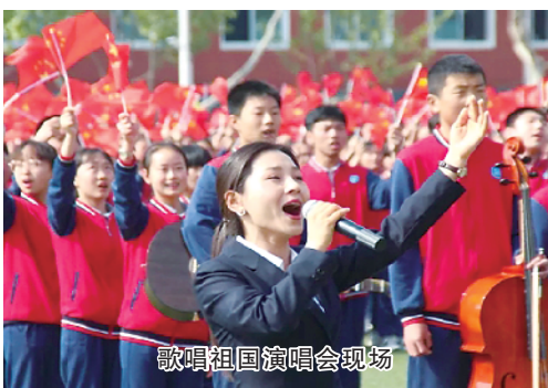
歌唱祖国演唱会现场