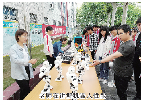
老师在讲解机器人性能