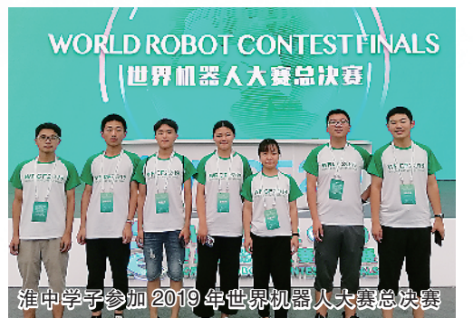
淮中学子参加2019年世界机器人总决赛