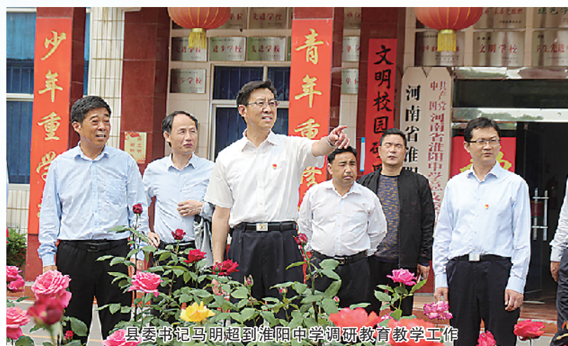
县委书记马明超到淮阳中学调研教育教学工作