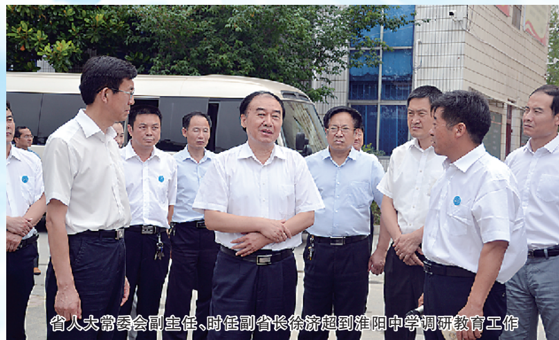
省人大常委会副主任、时任副省长徐济超到淮阳中学调研教育工作