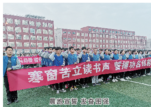
晨跑宣誓 发奋图强