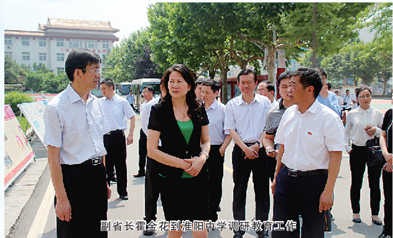
副省长霍金花到淮阳中学调研教育工作