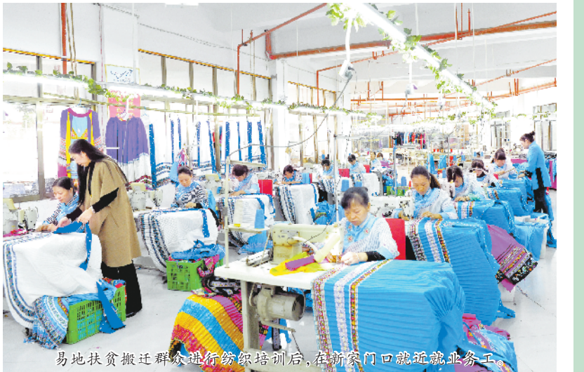
易地扶贫搬迁群众进行纺织培训后,在新家门口就近就业务工

…… 2020年6月底,随着晴隆县、望谟县减贫摘帽和全部脱贫,黔西南州9个县(市、新区)的贫困人口将全部实现脱贫,历史性绝对贫困问题将得到全面解决。①2